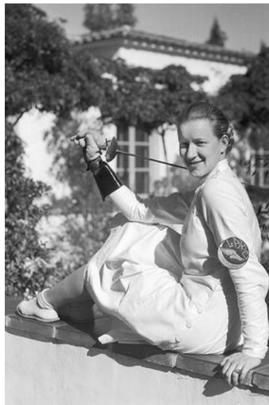
Obr. 30 Helene Mayer , stříbrná medailistka z Berlína 1936 v šermu, která byla židovského původu, ale byla jí dovolena účast na hrách – režim ji potřeboval

Zwischen Erfolg und Verfolgung, [online, vid. 30. 8. 2017], dostupné z: http://juedische-sportstars.de/index.php?id=174&L=0