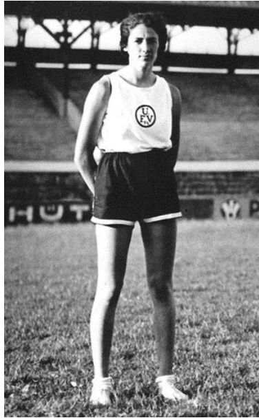
Obr. 29 Gertel Bergmann , atletka židovského původu, které nebylo dovoleno startovat na hrách v Berlíně 1936

Zwischen Erfolg und Verfolgung, [online, vid. 30. 8. 2017], dostupné z: http://juedische-sportstars.de/index.php?id=174&L=0