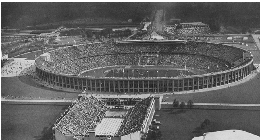
Obr. 18 Berlínský stadion během olympijských her 1936

World stadiums [online; vid. 29. 8. 2017], dostupné z: