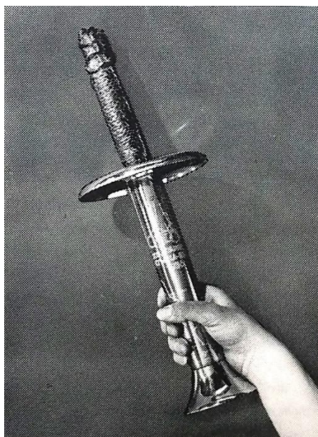
Obr. 17 Olympijská pochodeň pro štafetový běh

Národní archiv, fond: Československý výbor olympijský, kart. 53, Olympia Pressdienst, 28. 2. 1935, s. 1.