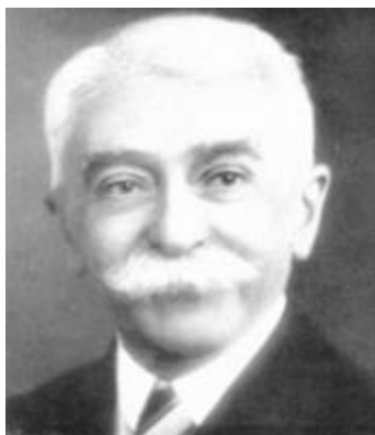
Obr. 1 Baron Pierre de Coubertin , zakladatel novodobých olympijských her