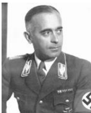
Obr. 5 Hans von Tschammer und Osten , říšský sportovní vůdce