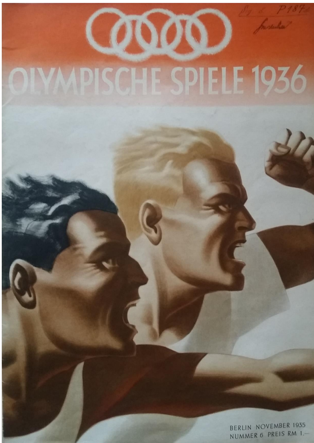
Obr. 15 Propagační materiál k berlínské olympiádě

Národní muzeum, Archiv tělesné výchovy a sportu, fond: Olympijské hry, kart. ZOH Garmisch-Partenkirchen 1936 1.