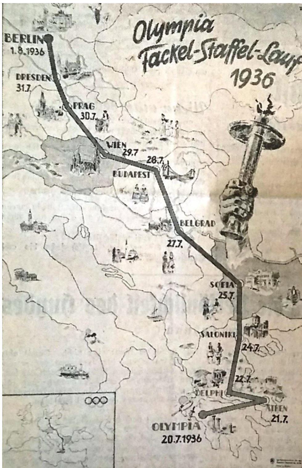
Obr. 24 Mapa štafetového běhu s olympijským ohněm (velmi nepřesná hranice Československa) Národní archiv, fond: Československý výbor olympijský, kart. 48, Erstes Beiblatt nr. 68, 19. 3. 1936, s. 1.