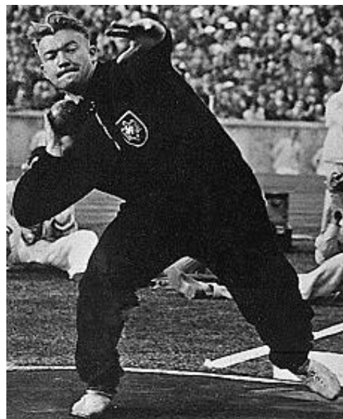
Obr. 28 Hans Woellke , olympijský vítěz ve vrhu koulí a pozdější velitel skupiny policejního praporu Waffen SS

http://www.cleveland.com/opinion/index.ssf/2010/11/finally_a_cleveland_street_nam.html