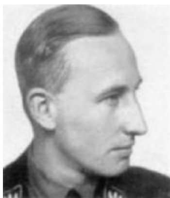
Obr. 8 Reinhard Heydrich , říšský vedoucí SS, zástupce Himmlera a člen německého olympijského výboru