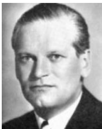
Obr. 6 Karl Ritter von Halt , předseda německého olympijského výboru