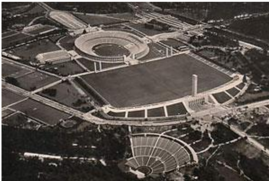
Obr. 19 Olympijská sportoviště

http://www.worldstadiums.com/stadium_menu/architecture/stadium_design/pictures/berlin_olympiastadion/berlin_olympiastadion1.jpg