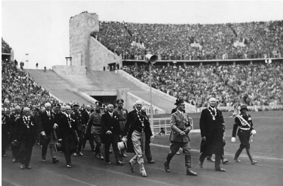
Obr. 22 Hlavní představitelé olympijských her v čele s Hitlerem při vstupu na zahájení

Hoover institution, [online; vid. 29. 8. 2017], dostupné z: http://www.hoover.org/news/olympics-eighty-years-ago-hoover-archives-receives-publications-1936-berlin-games