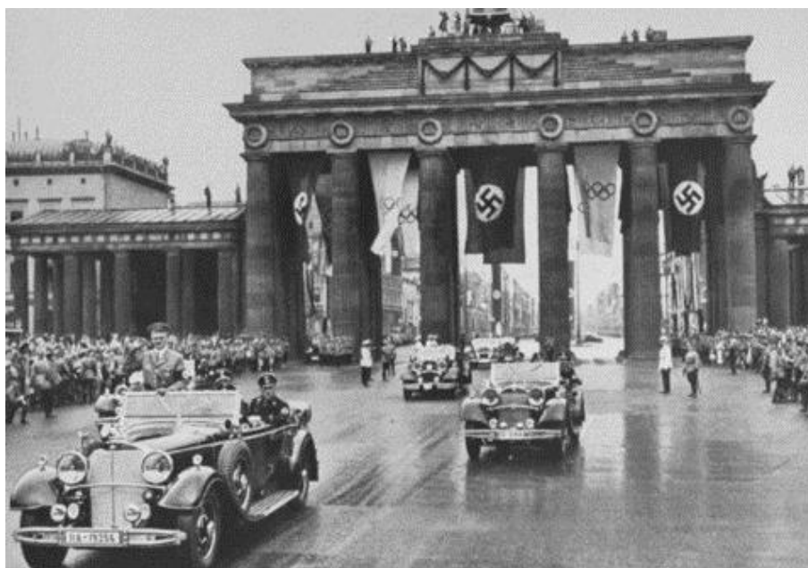
Obr. 21 Hitlerův konvoj projíždí cestou na zahajovací ceremoniál Brandenburskou bránou