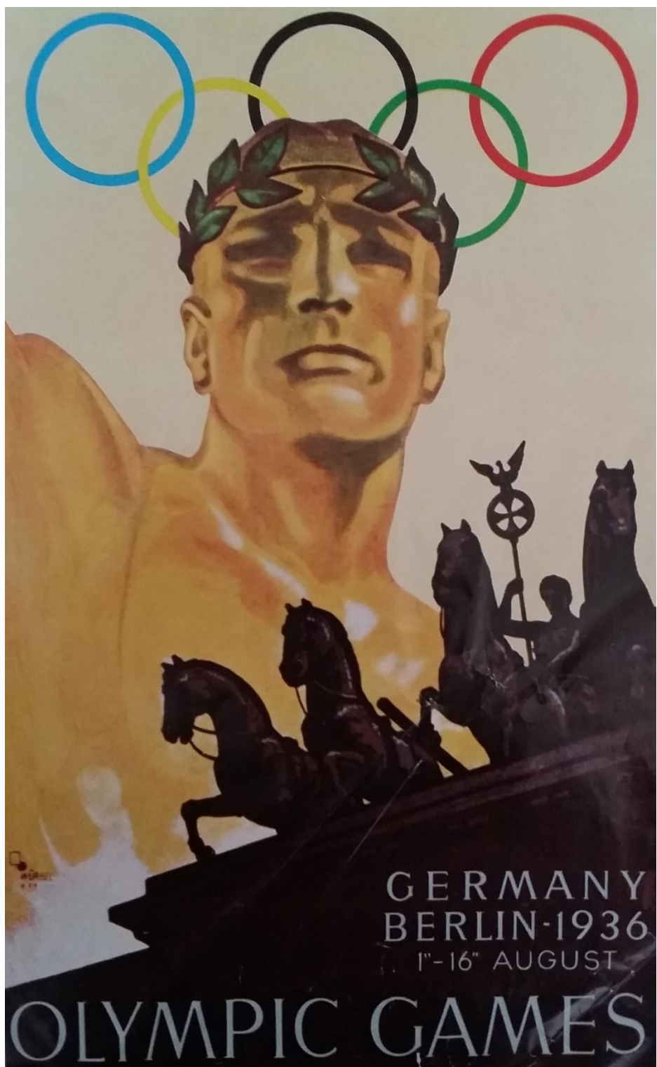
Obr. 13 Oficiální plakát letních olympijských her v Berlíně 1936