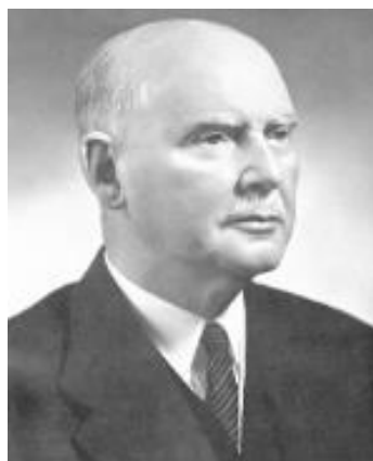
Obr. 4 Dr. Theodor Lewald , prezident organizačního výboru Olympijských her v Berlíně