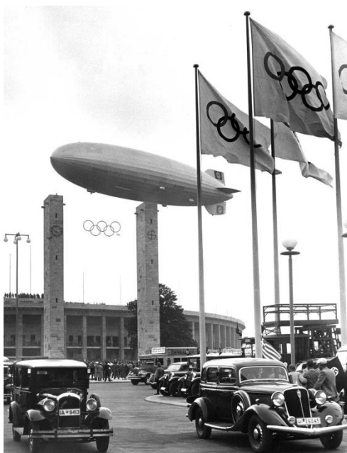
Obr. 20 Přelet vzducholodi Hindenburg přes stadion při zahájení olympiády v Berlíně