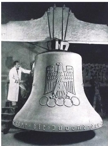
Obr. 16 Zvon – symbol olympijských her v Berlíně 1936

Národní archiv, fond: Československý výbor olympijský, kart. 53, Olympia Pressdienst, 28. 2. 1935, s. 1.