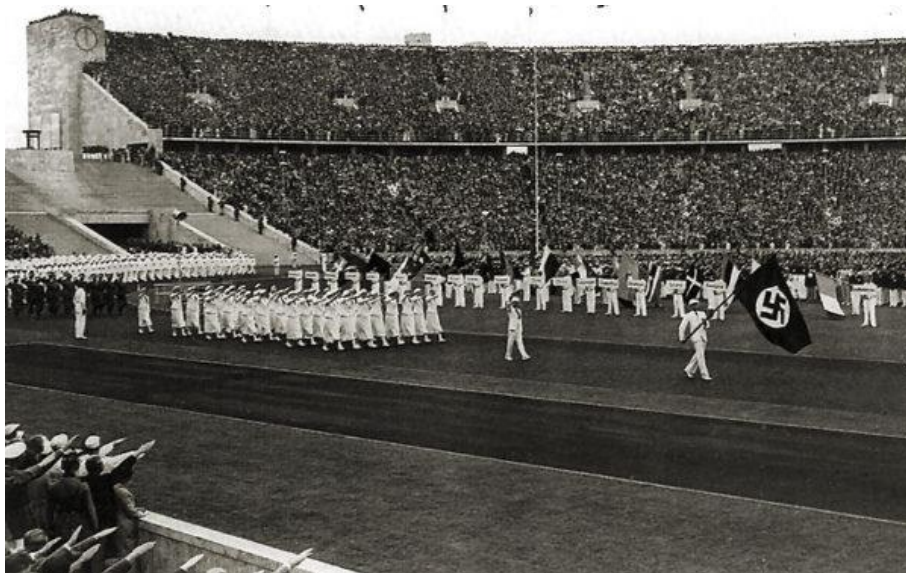
Obr. 23 Nástup německého družstva

Hoover institution, [online; vid. 29. 8. 2017], dostupné z: http://www.hoover.org/news/olympics-eighty-years-ago-hoover-archives-receives-publications-1936-berlin-games