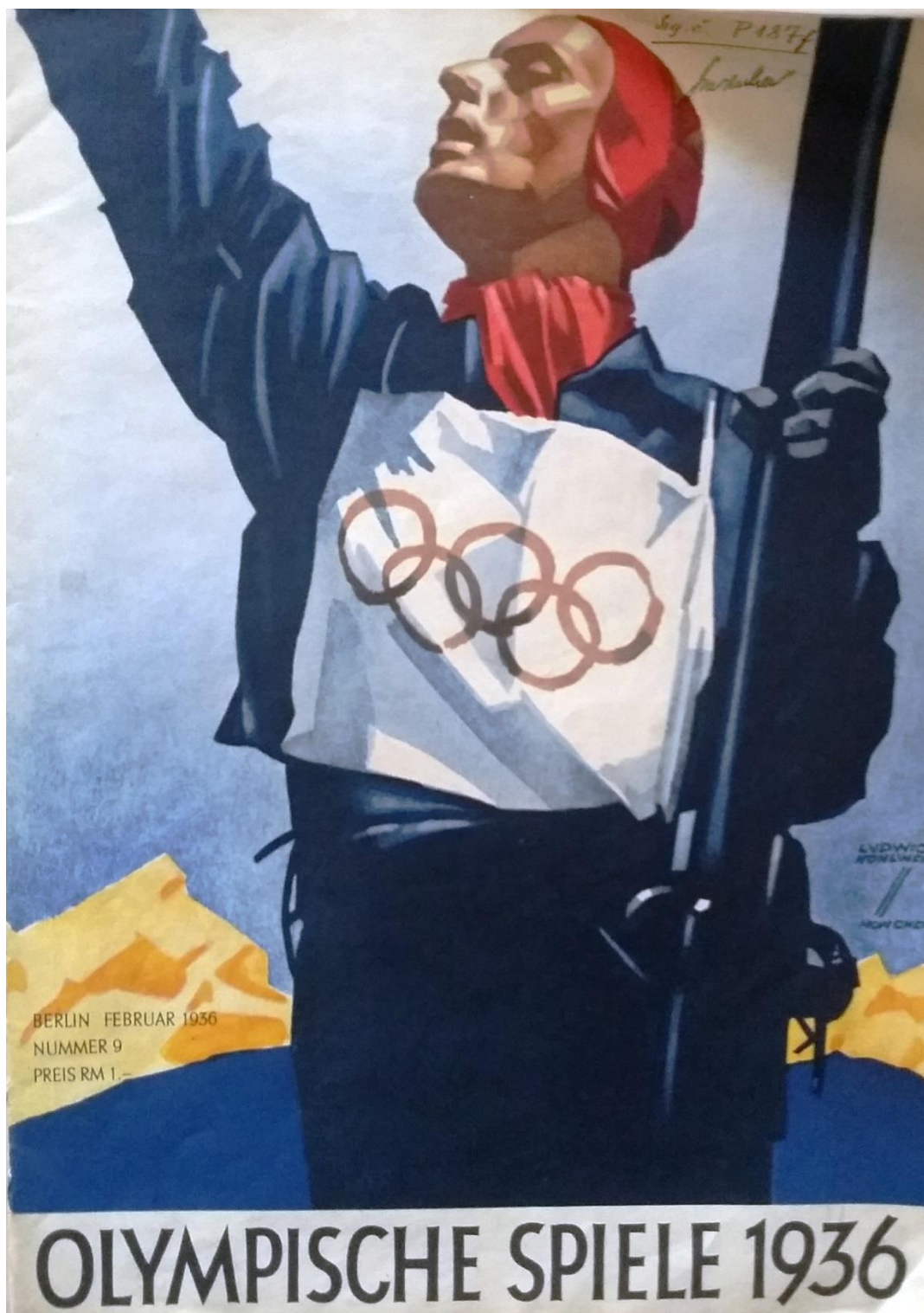
Obr. 12 Oficiální plakát pro zimní olympijské hry v Garmisch-Partenkirchenu 1936

Národní muzeum, Archiv tělesné výchovy a sportu, fond: Olympijské hry, kart. ZOH Garmisch-Partenkirchen 1936 1.