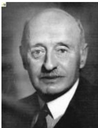
Obr. 2 Hrabě Henri de Baillet-Latour , předseda MOV