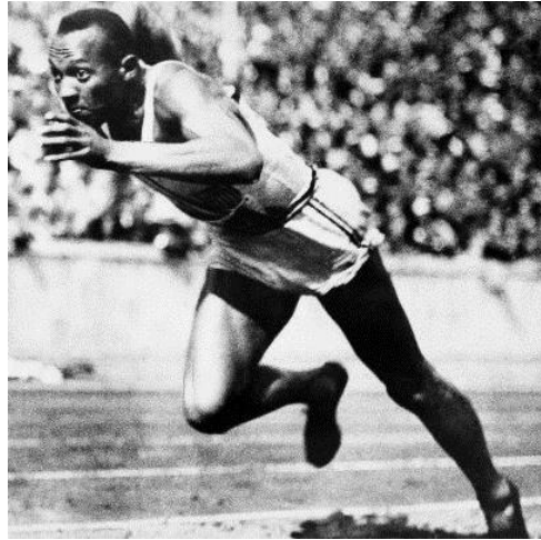
Obr. 27 Jesse Owens , čtyřnásobný olympijský vítěz v Berlíně 1936

Cleveland.com, [online, vid. 29. 8. 2017], dostupné z: