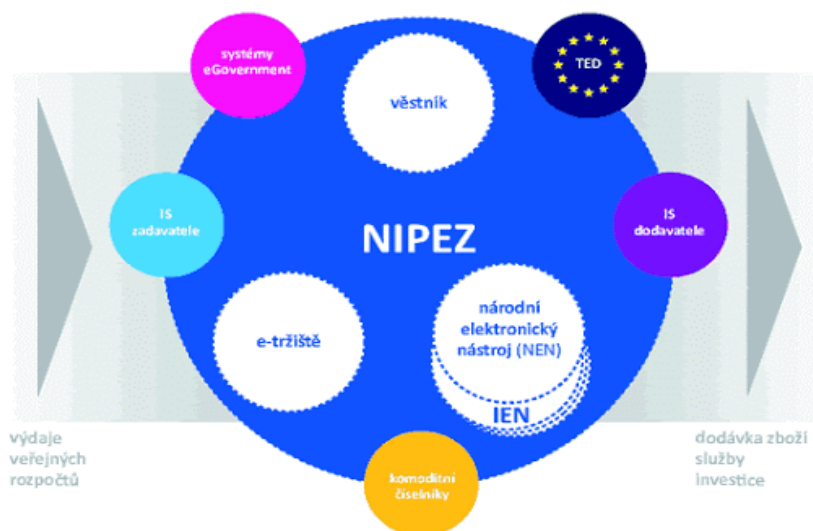
Ilustrace 1: NIPEZ