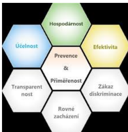
Ilustrace 3: Princip 3E

Skrytou diskriminací se rozumí nastavením takových pravidel v rámci zadávacího řízení, která znemožní některým z řad dodavatelů účastnit se výběrového řízení, a které neodpovídají obecné povaze předmětu veřejné zakázky co do velikosti, technického řešení, případně jeho složitosti.