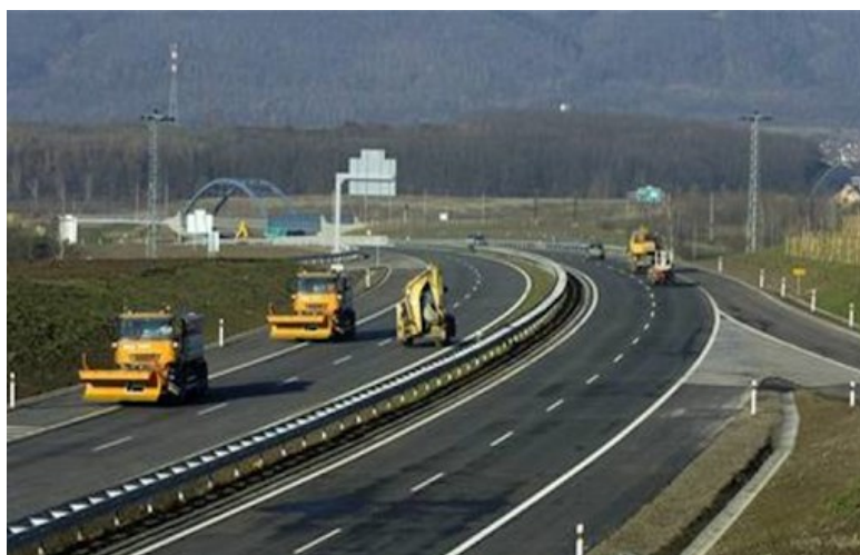
Ilustrace 4: CIJ Europe