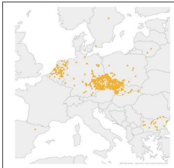
Obrázek 2. Umístění míst souvisejících s výrobou metamfetaminu v EU, 2018–2020 (EMCDDA, 2022)

V roce 2020 bylo v České republice odhaleno 160 nelegálních laboratoří na výrobu metamfetaminu, což je menší počet než v předchozím roce 2019, kdy jich bylo 234. Z těchto laboratoří mělo přibližně dvě třetiny výrobní kapacitu do 50 gramů. Pokles počtu odhalených laboratoří v Česku v roce 2020 je pravděpodobně způsoben nedostatkem léků obsahujících pseudoefedrin a dalších potřebných látek pro výrobu, který byl ve vybraných oblastech způsoben pandemií COVID-19. (EMCDDA, 2022)