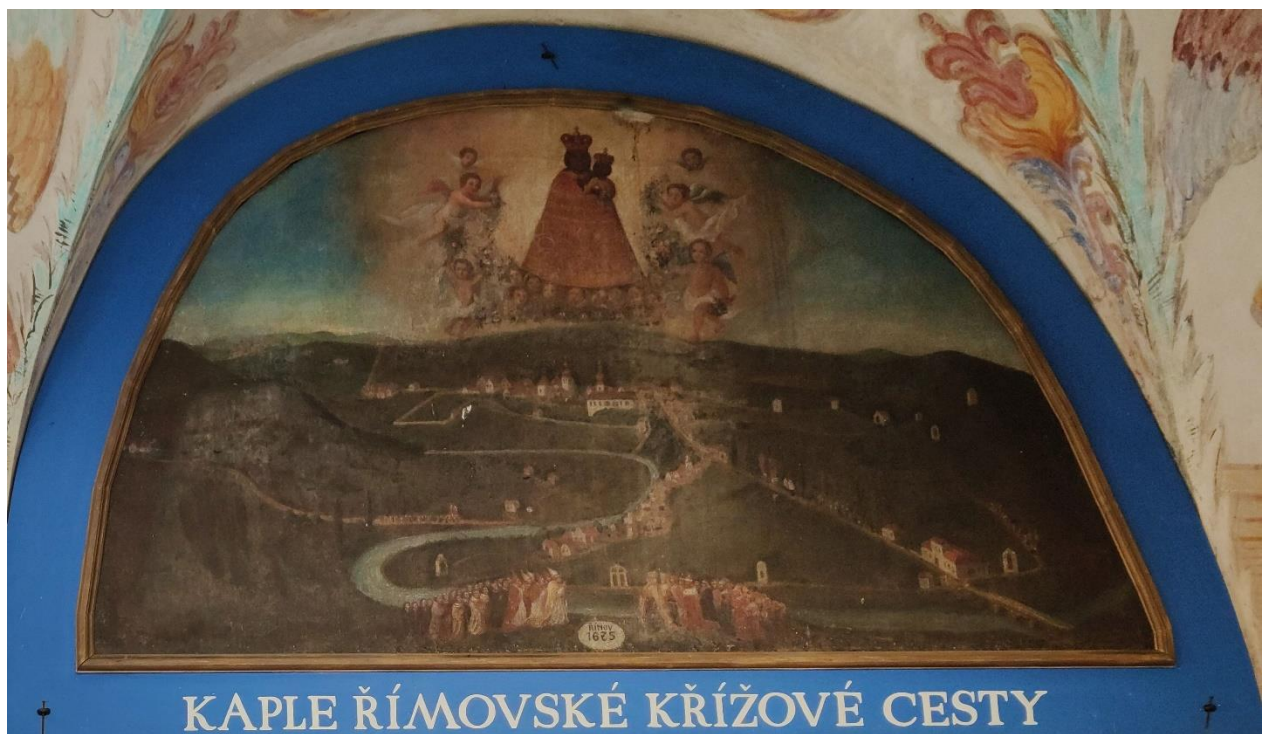
Obr. č. 2: Obrázek ze svěcení pašijové cesty.