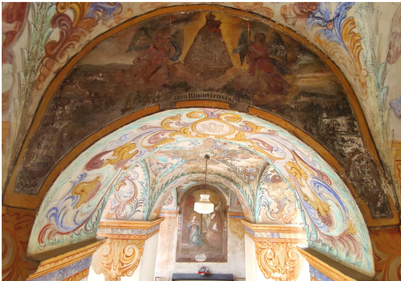
Obr. č. 1: Diva Rimovensis z ambitů.