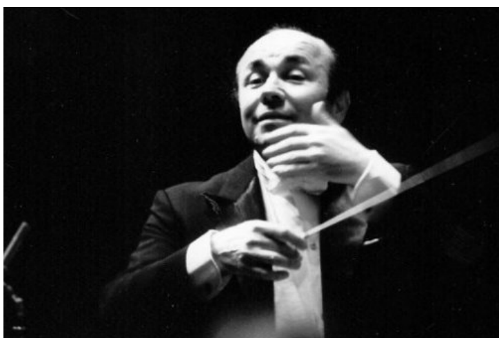
Obr. 4: Zdeněk Košler – dirigent a šéf opery MDO v letech 1958-1962 111