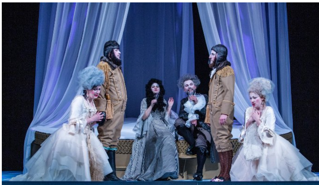
Obr. 20: Opera Così fan tutte – W.A.Mozart 127