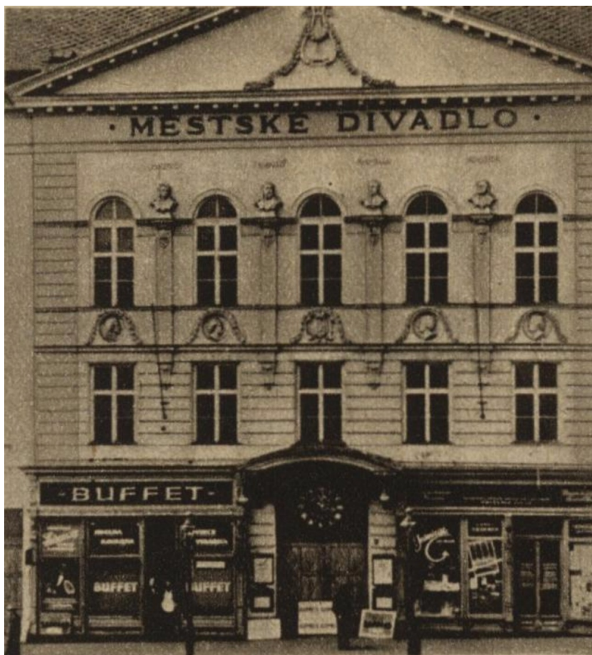
Obr. 1: Městské divadlo v roce 1945 108