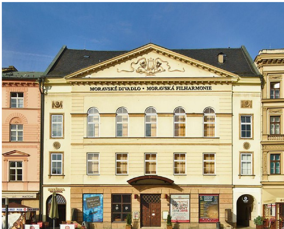
Obr. 13: Moravské divadlo Olomouc 120