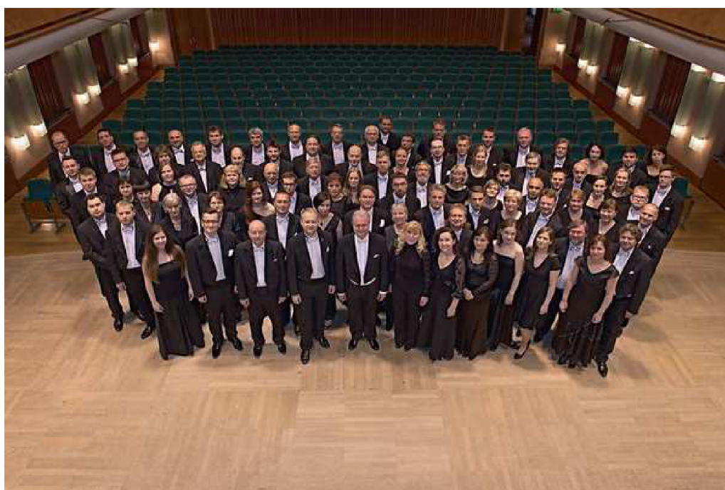
Obr. 18: Moravská filharmonie Olomouc 125