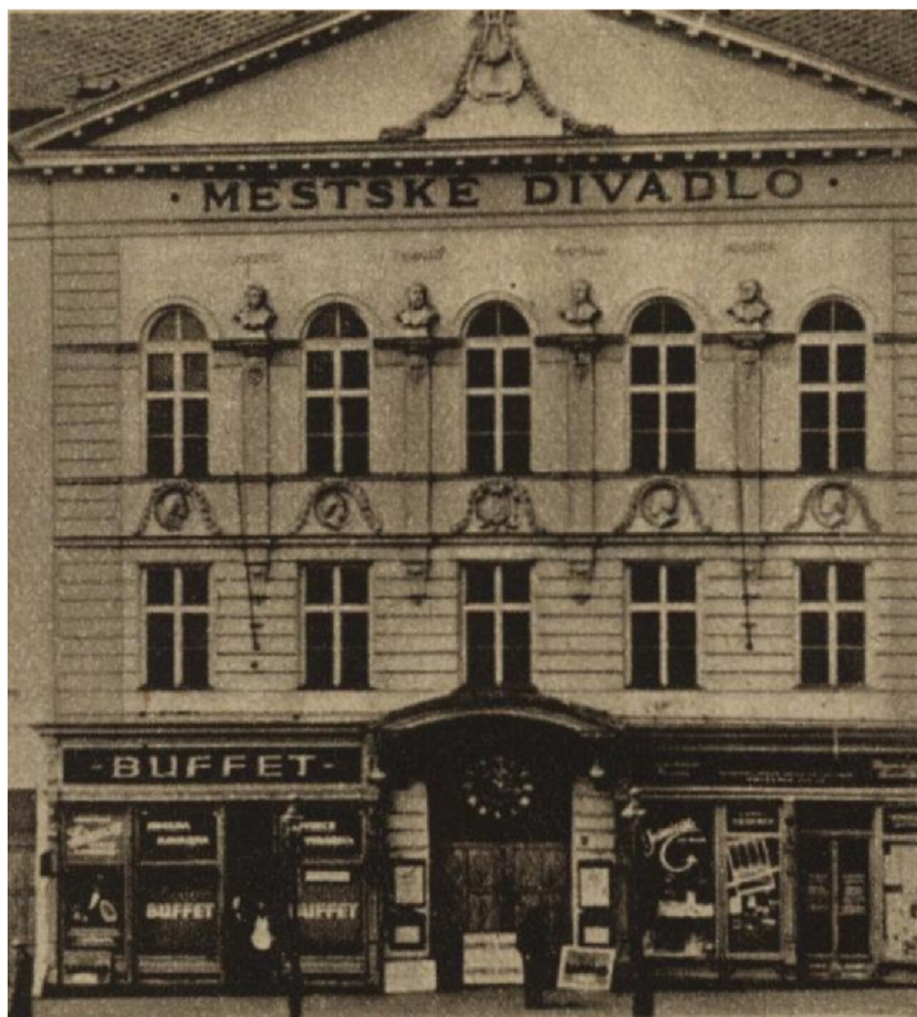
Obr. 1: Městské divadlo v roce 1945 108