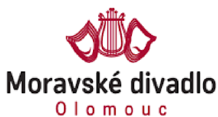
Obr. 14: Logo Moravského divadla Olomouc 121