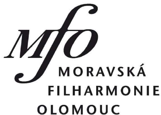
Obr. 15: Původní logo Moravské filharmonie Olomouc 122