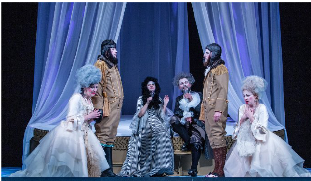
Obr. 20: Opera Cosi fan tutte – W.A.Mozart 127