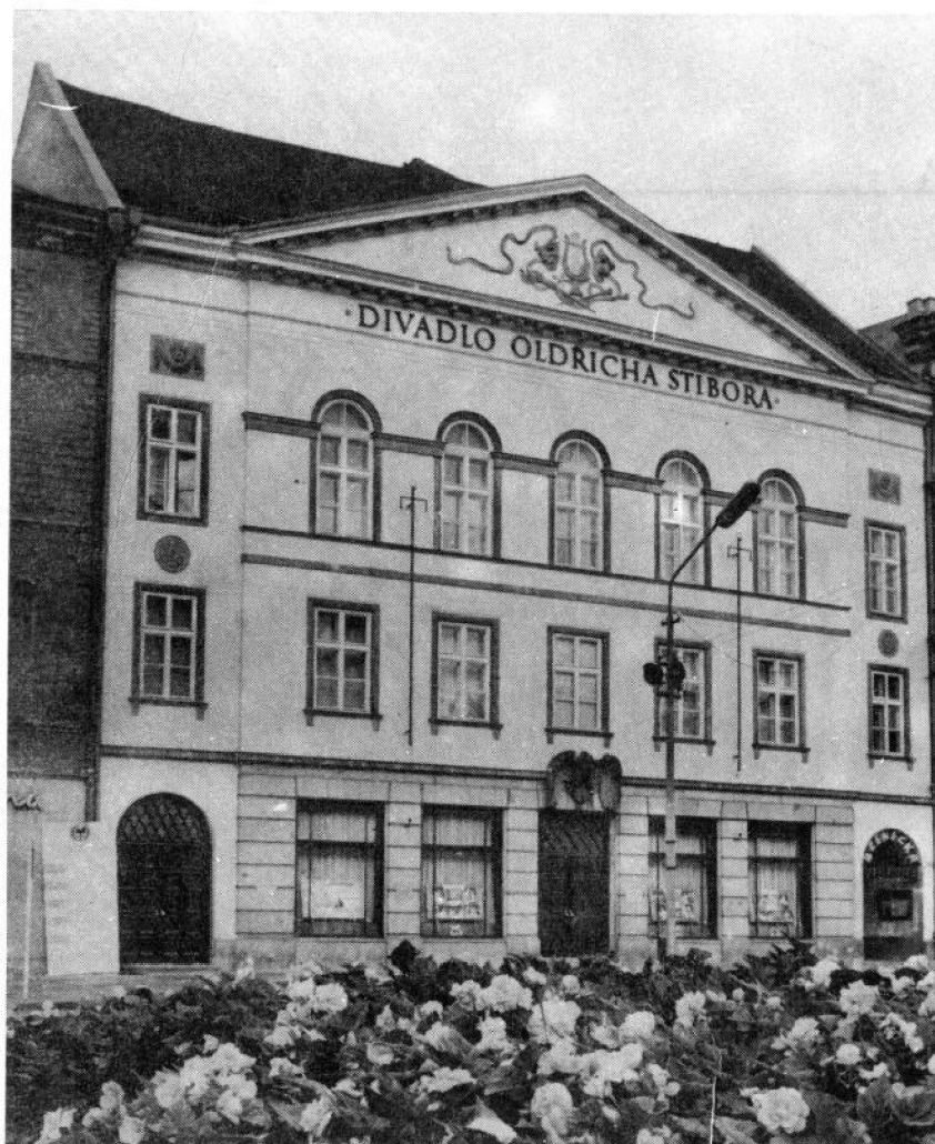
Obr. 2: Divadlo Oldřicha Stibora v roce 1958 109