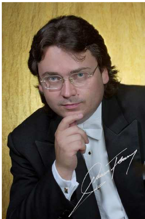
Obr. 9: František Preisler – šéfdirigent MFO od roku 2002 116