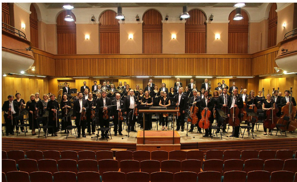
Obr. 17: Moravská filharmonie Olomouc v Redutě 124