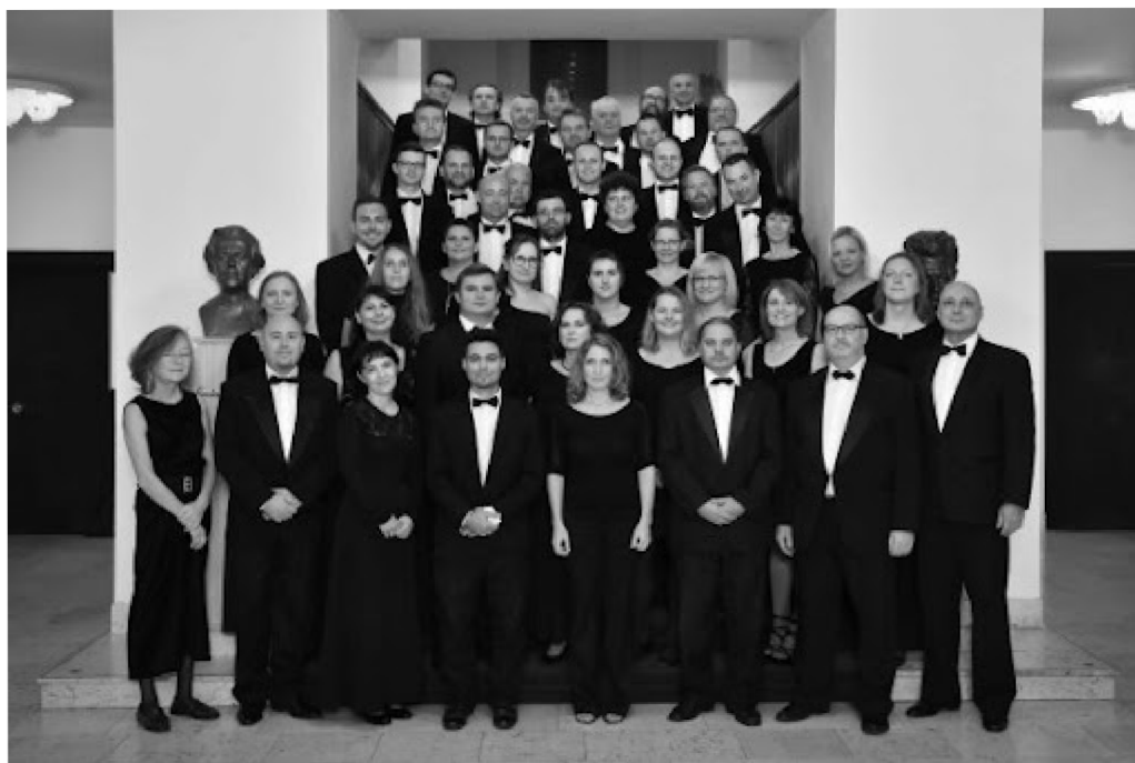
Obr. 12: Orchestr Moravského divadla Olomouc 119