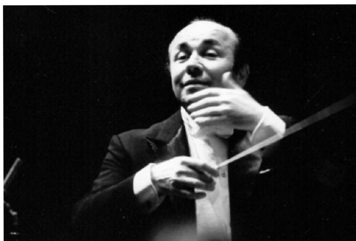
Obr. 4: Zdeněk Košler – dirigent a šéf opery MDO v letech 1958-1962 111