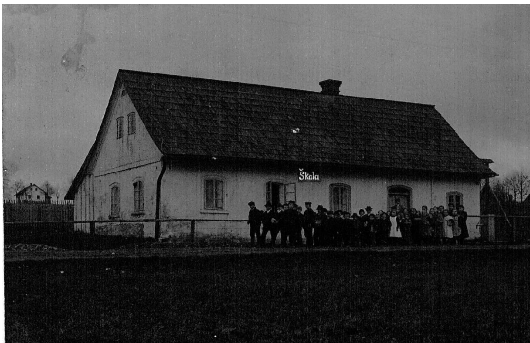
Obr. 8: Fotografie první české matiční školy v Rokytnici v O. h. Jedná se o dům čp. 50, který zakoupila NJS prostřednictvím J. Štefka, za účelem stavby školy.