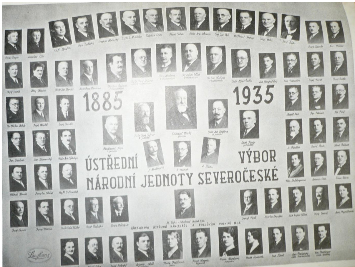
Obr. 3: Fotografie členů ÚV u příležitosti 50. výročí působení Národní jednoty severočeské.