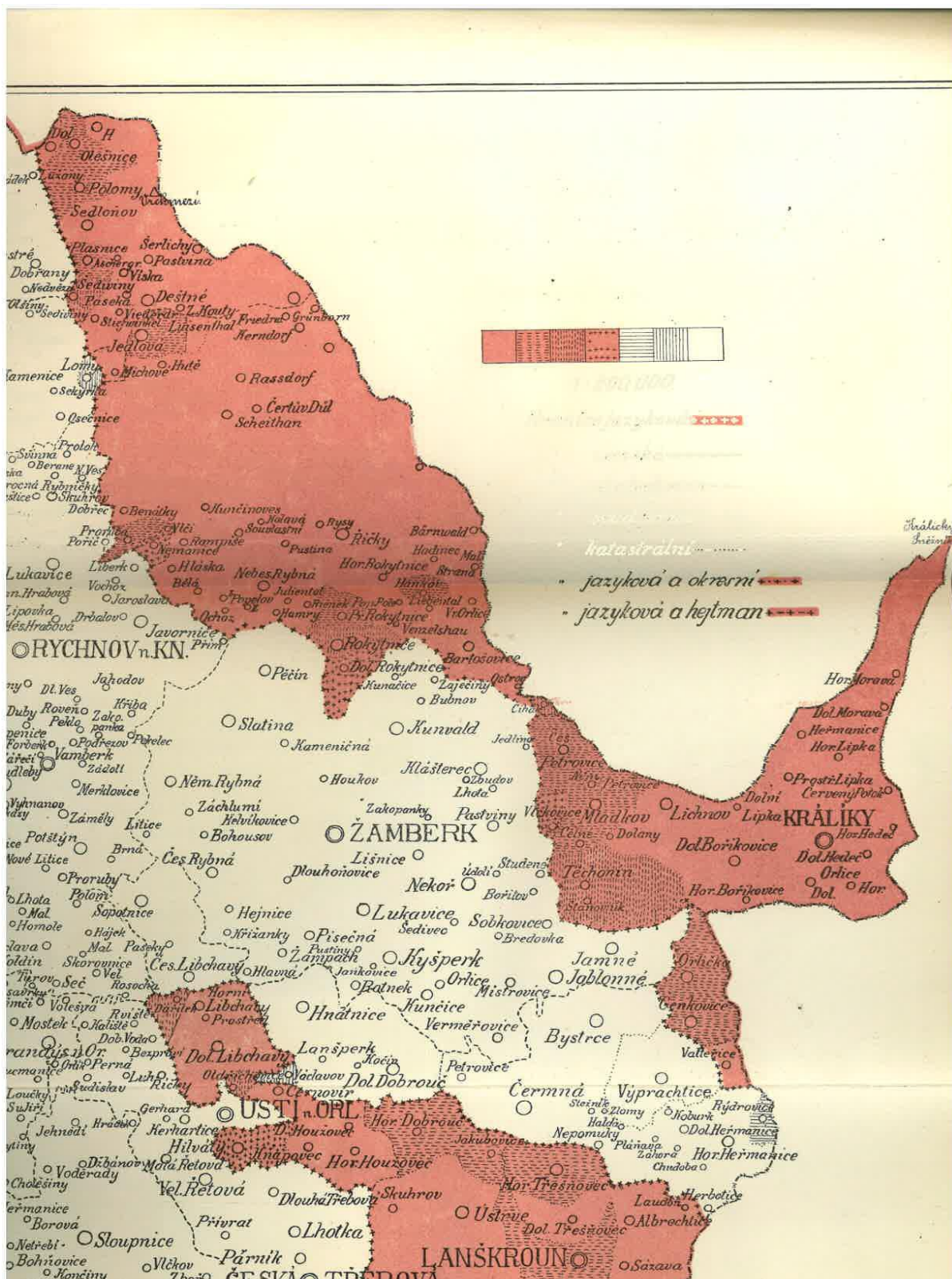
Obr. 1: Národnostní mapa území Orlických hor na přelomu 19. a 20. století

Převzato: ŠUBRT, J. České menšiny v severovýchodních a východních Čechách . Praha 1910.