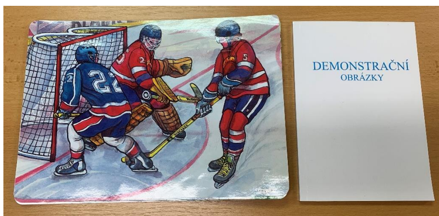
Obrázek 7 Demonstrační obrázky

Ano, používáme knihy, hudební nástroje pro sluchové vnímání, hry na procvičení barev, různé postavy zvířat, demonstrační obrázky, sady obrázkových karet a hry na logické řazení obrázků.