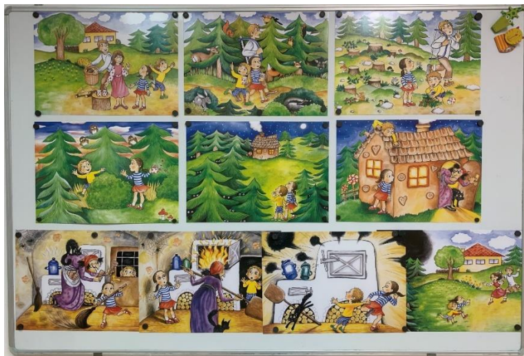
Obrázek 6 Pohádkové obrázky

Dalšími pomůckami jsou básničky, pracovní listy, písničky, prohlížení knih (individuální rozhovor), pexeso, domino, zkrátka hry, kde můžu s dítětem komunikovat.