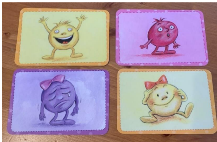
Obrázek 5 Emoce – Obrázkové karty

Používáme obrázkové karty, které vyjadřují emoce. Dítě si vybere kartičku, která vyjadřuje jeho aktuální náladu a snaží se jí popsat. Ptám se „proč se na mě dneska mračíš?“ a dítě odpovídá.