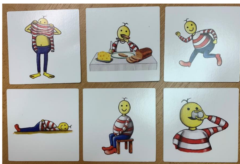
Obrázek 8 Kartičky denního režimu

Ano. Používám obrázky, praktické ukázky věci ve třídě, kartičky denního režimu. To co právě děláme, tak pojmenovávám a popisuji.