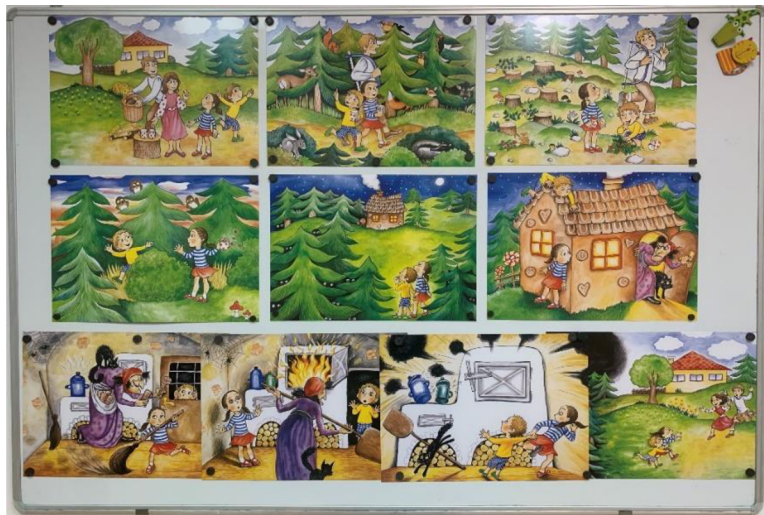
Obrázek 6 Pohádkové obrázky

Dalšími pomůckami jsou básničky, pracovní listy, písničky, prohlížení knih (individuální rozhovor), pexeso, domino, zkrátka hry, kde můžu s dítětem komunikovat.