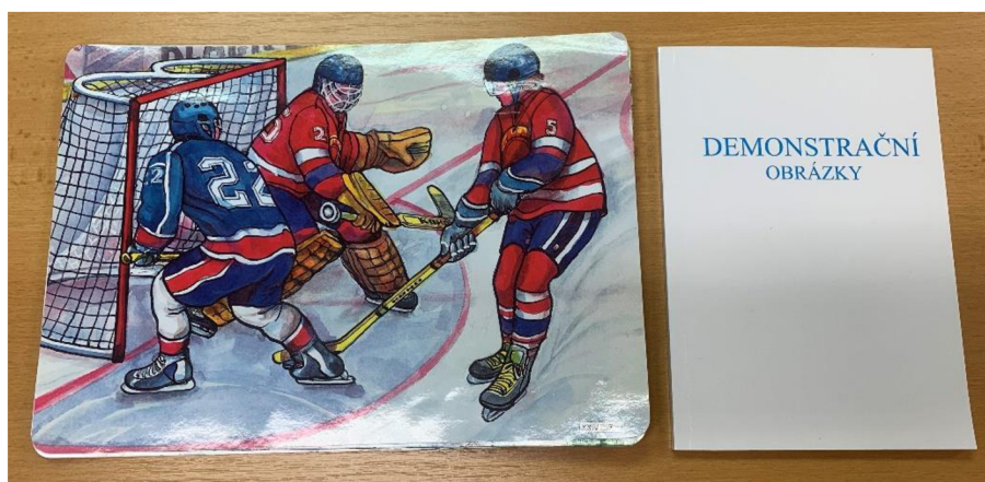
Obrázek 7 Demonstrační obrázky

Ano, používáme knihy, hudební nástroje pro sluchové vnímání, hry na procvičení barev, různé postavy zvířat, demonstrační obrázky, sady obrázkových karet a hry na logické řazení obrázků.