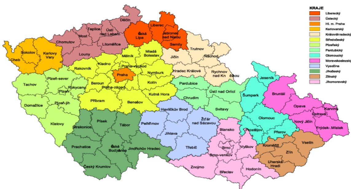
Obrázek č. 1: Mapa České republiky s vyznačením krajů a okresů

Město Cheb bylo v letech 2000 – 2003 medializováno, jak u nás tak i v zahraničí, velkou kampaní, která prezentovala sexuální zneužívání dětí, kterou rozpoutala nevládní organizace „Karo“ působící v česko-německé příhraniční oblasti. Poloha chebského regionu mohla být příčinou tohoto stavu, neboť nejdelší státní hranice s cizím státem v rámci celé České republiky připadá právě okresu Cheb.