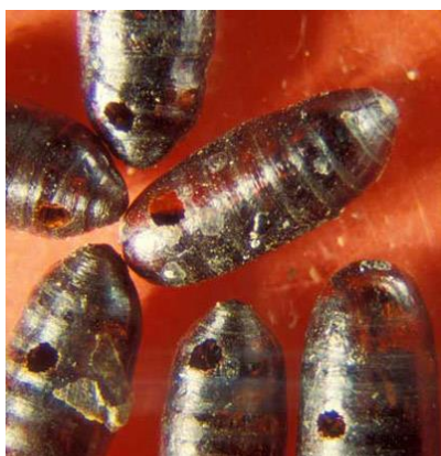
Příloha XV – Kukly mouchy domácí, napadené parazitickou vosičkou. K požívání kukly mouchy dochází v larválním stádiu vosy, která jako dospělec opouští muší kuklu viditelným otvorem.