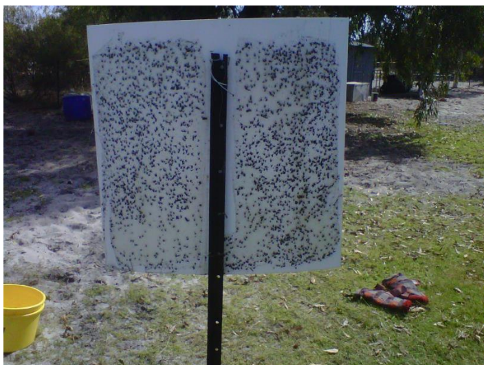
Příloha VIII – Lapák podle Williamse. DPIRD, USA.