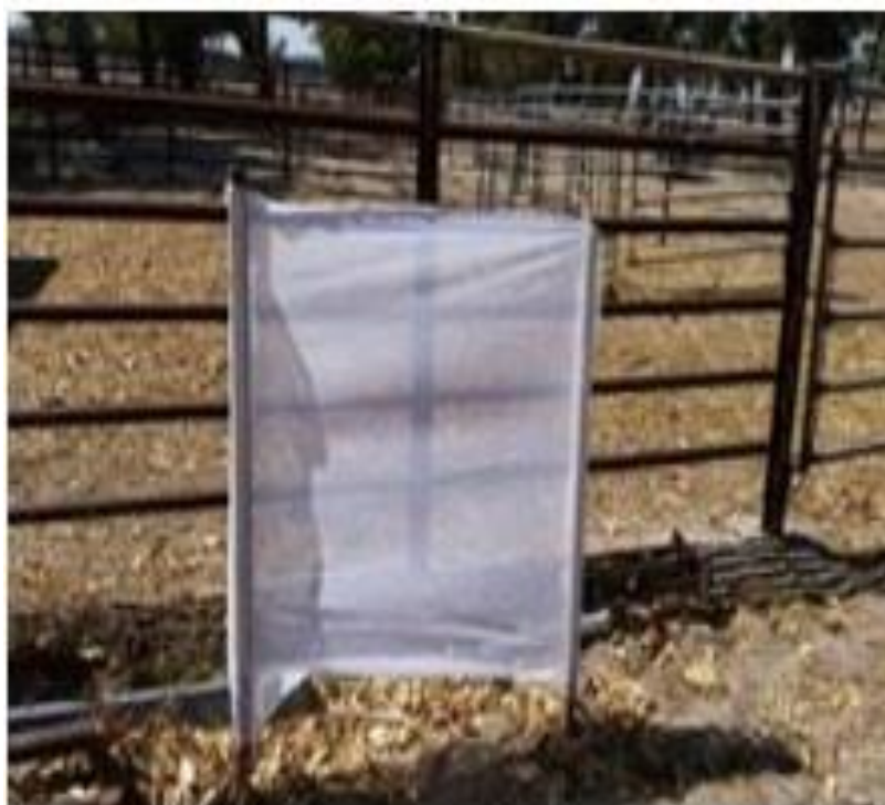
Příloha XII – Látkový lapák s použitím průhledné látky. Foil a Hogsette.