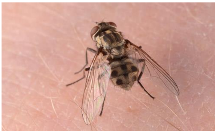
Příloha V – Dospělý jedinec bodalky stájové. Lyle Buss, University of Florida.