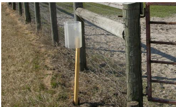
Příloha IX – Olsonovův lapák (alsynitový), určený pro monitoring bodalky stájové. Phillip Kaufman, University of Florida.