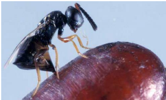
Příloha XIV – Kladení vajíček parazitickou vosičkou Muscidifurax raptor . Samička do zvolené kukly naklade vlastní vajíčka, která se v průběhu vývinu živí kuklou bodalky stájové.