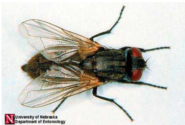
Příloha III – Dospělý jedinec mouchy domácí. Jim Kalish, University of Nebraska-Lincoln.