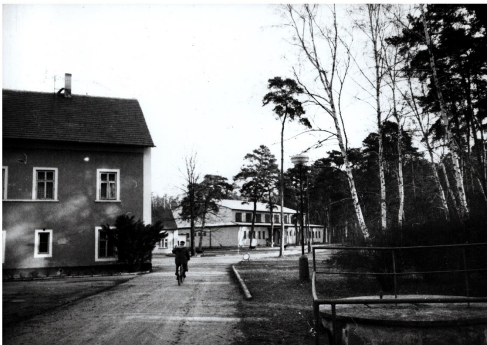
Obrázek 9 Vzadu nová tělocvična