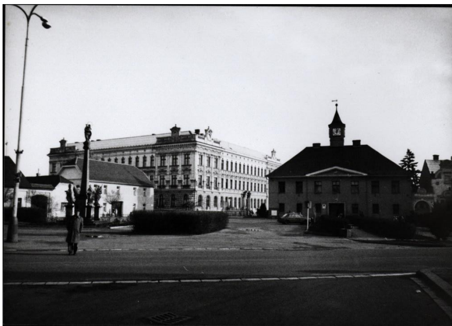
Obrázek 3 Současná budova školy postavená roku 1902, zdroj: Soukromý archiv