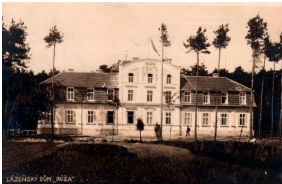
Obrázek 2 Lázeňský dům Růža v roce 1925

o 37 pokojů. Ten, kdo vyhledával rušný lázeňský život, jezdil do Poděbrad, kdo chtěl zažít klidnou atmosféru, volil Sadskou.