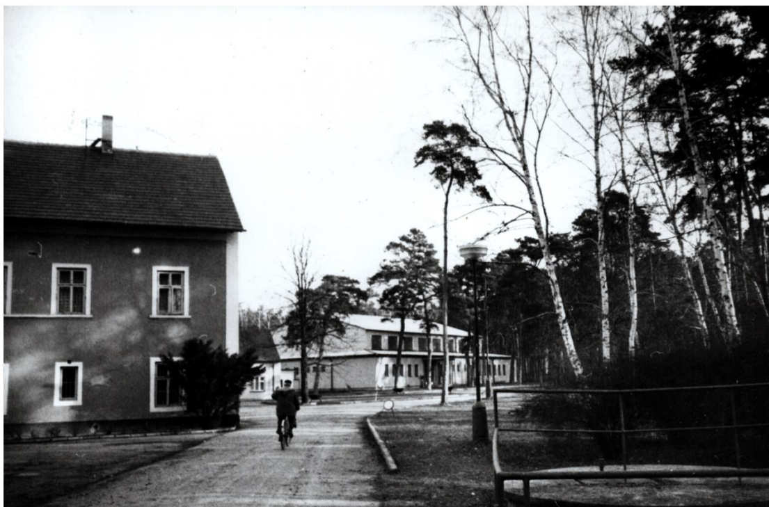
Obrázek 9 Vzadu nová tělocvična

Prvním novým oborem byla Speciální rodinná škola (později Praktická škola), čímž se zřídila tříletá Praktická škola zaměřená na stavební, kuchařské, knihařské, oděvní práce. Dvouletá a jednoletá praktická škola pak fungovala jako jedna z možností pro neúspěšné žáky zvláštní školy.