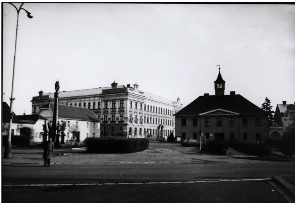
Obrázek 3 Současná budova školy postavená roku 1902, zdroj: Soukromý archiv

Škola v současné podobě byla vystavena roku 1902. Je to velkolepé dílo, dříve rozdělené na měšťanskou dívčí a chlapeckou část. Bývalá budova školy se předělala na městské muzeum. Nyní má základní škola čtyři budovy a využívá ji na 500 žáků.