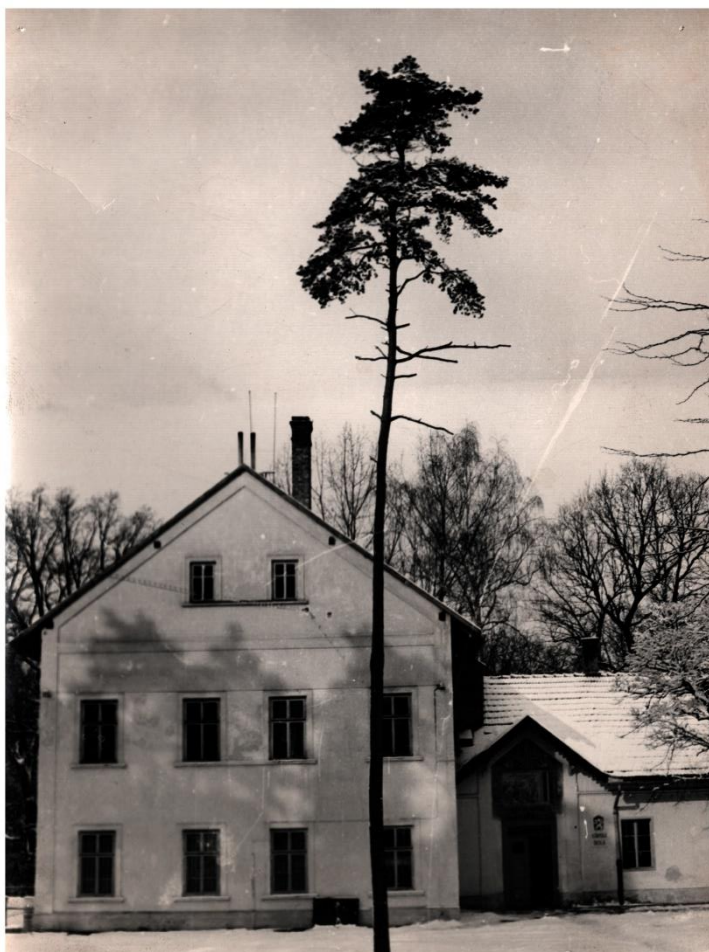
Obrázek 4 Hlavní budova školy, zdroj: Soukromý archiv Jiřího Nováka

Od září roku 1955 se mění název na „Učňovská škola“ a po odchodu cukrářů jsou zde učňové oboru zednického, malířského a pokrývačského, školu navštěvuje 125 učňů, doba učení je dva roky. Zahrnuti byli i žáci s těžšími druhy postižení – ti, kteří mají problémy s artikulací i lehčí formy obrny.