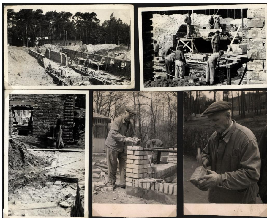
Obrázek 7 Fotografie prací opravy učiliště