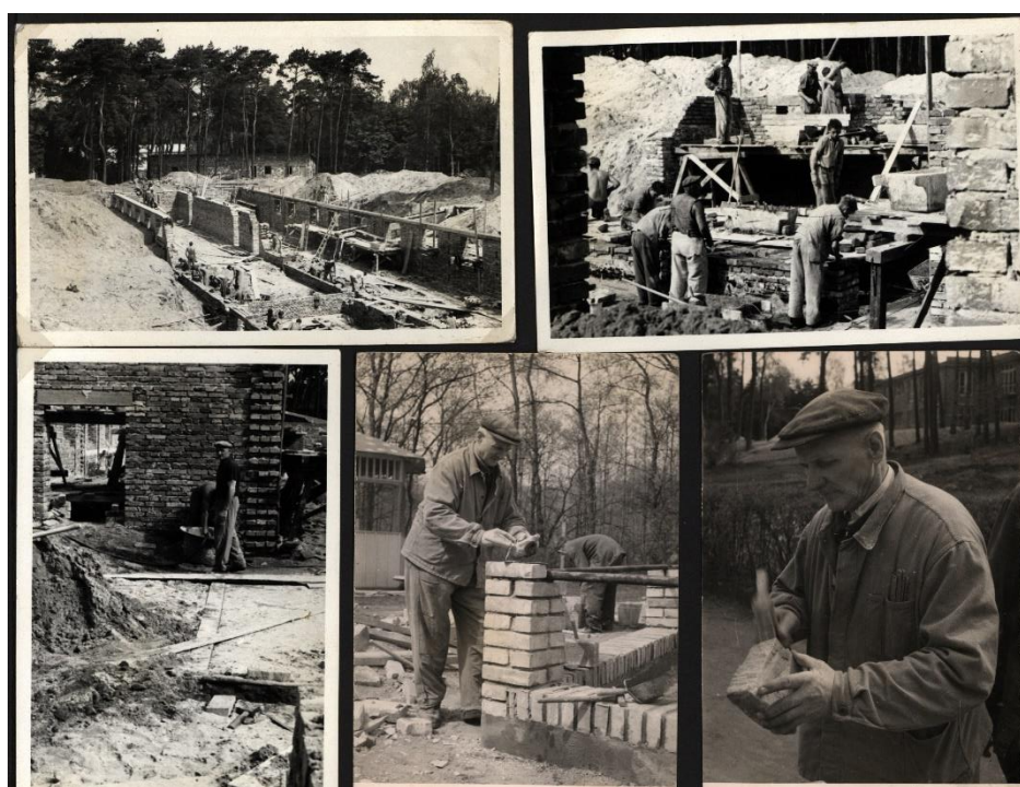
Obrázek 7 Fotografie prací opravy učiliště, zdroj: Soukromý archiv Jiřího Nováka

Ve školním roce 1960–61 navštěvuje školu 94 učňů s opožděným tělesným vývojem v oborech zemědělství – 17 učňů, zednictví – 45 učňů, malířství – 32 učňů. Počet učňů musel být po požáru vily Růže značně snížen a nevystačí tak místa na všechny učně. Po požáru jsou učni ubytováni v tělocvičně a třech učebnách. Od května se staví nový internát o kapacitě 130 lůžek včetně jednotky pro údržbáře a topiče a kulturní místnosti. Stavba je prováděna svépomocí, staví učni za vedení odborných mistrů a řídí je Okresní stavební podnik Nymburk. Stavba má být do tvaru U, jednopatrová a staví se při cestě. K 1. září 1962 má být předána.