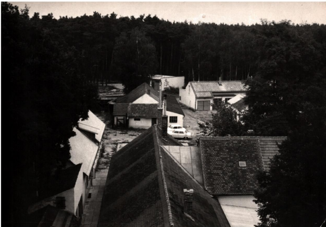
Obrázek 10 Pohled z komína hlavní budovy na přistavěné dílny, garáže, sklady

Zkušenosti získané při výstavbě internátní budovy přesvědčily pracovníky školy o tom, že je možno svépomocí a za spoluúčasti žáků školy pracovat na stavbách, které budou sloužit učňům. To se stalo základem pro další rozvoj celého učiliště. Byly vystavěny garáže, sklady, malířská a natěračská dílna.