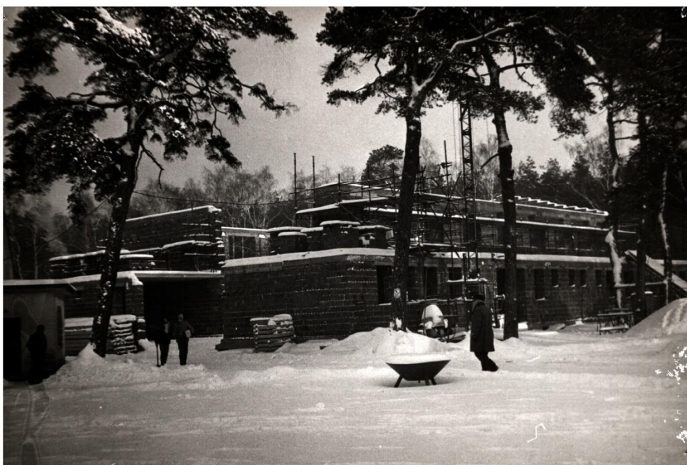
Obrázek 8 Stavba nové tělocvičny a dílen za ředitelů Horský / Číhal