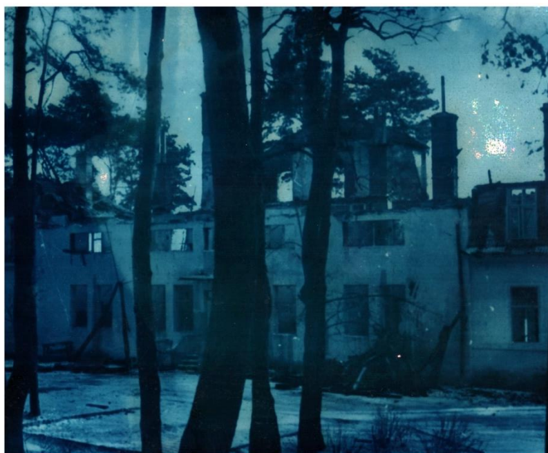
Obrázek 6 Internát Růža po vyhoření, leden 1960

Dne 15. ledna 1960 vypuknul požár internátní budovy Růža a 93 učňů ve věku 15–18 let se ocitlo bez přístřeší. Všichni pracovníci byli náhle postaveni před závažné rozhodnutí, jestli školu v samých počátcích zrušit, nebo se pustit svépomocí do výstavby nového internátu. Chod školy byl přerušen jen na krátký čas, úsilím všech pracovníků a žáků se povedlo školu zachránit a během roka a půl postavil společně se studenty internát nový.