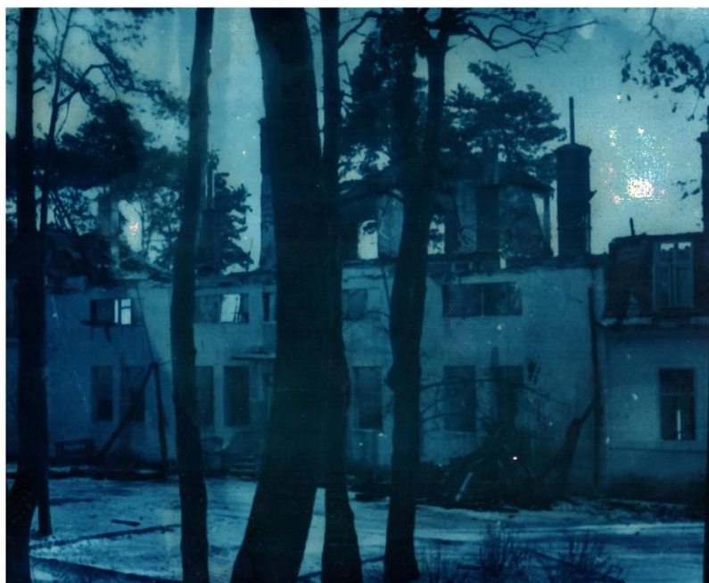
Obrázek 6 Internát Růža po vyhoření, leden 1960