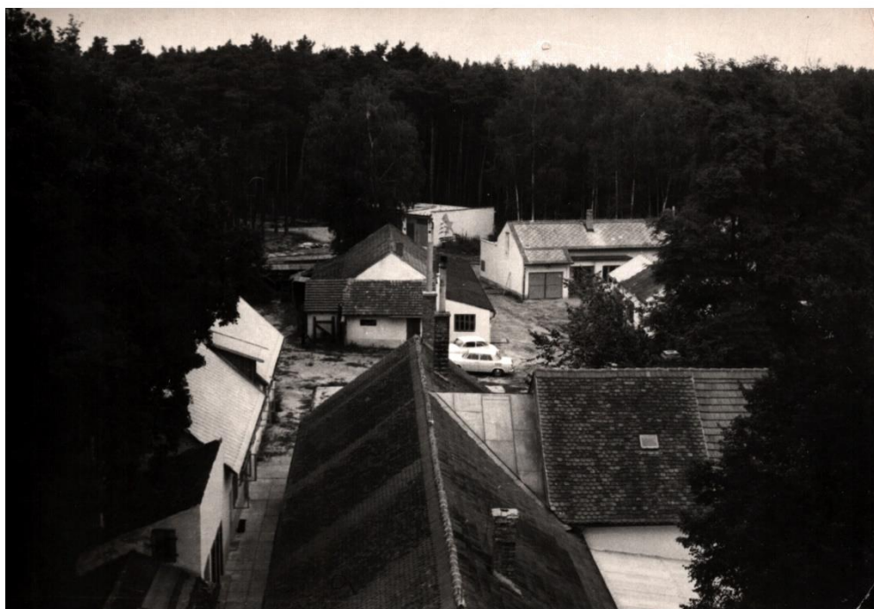
Obrázek 10 Pohled z komína hlavní budovy na přistavěné dílny, garáže, sklady, zdroj: Soukromý archiv Jiřího Nováka