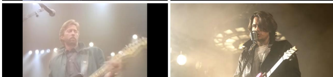
Obrázek 4 Vlevo: Forever Man ; vpravo: Last Train Home