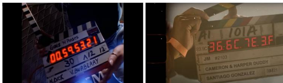
Obrázek 3 Vlevo: Sweet Child O' Mine ; vpravo: Last Train Home