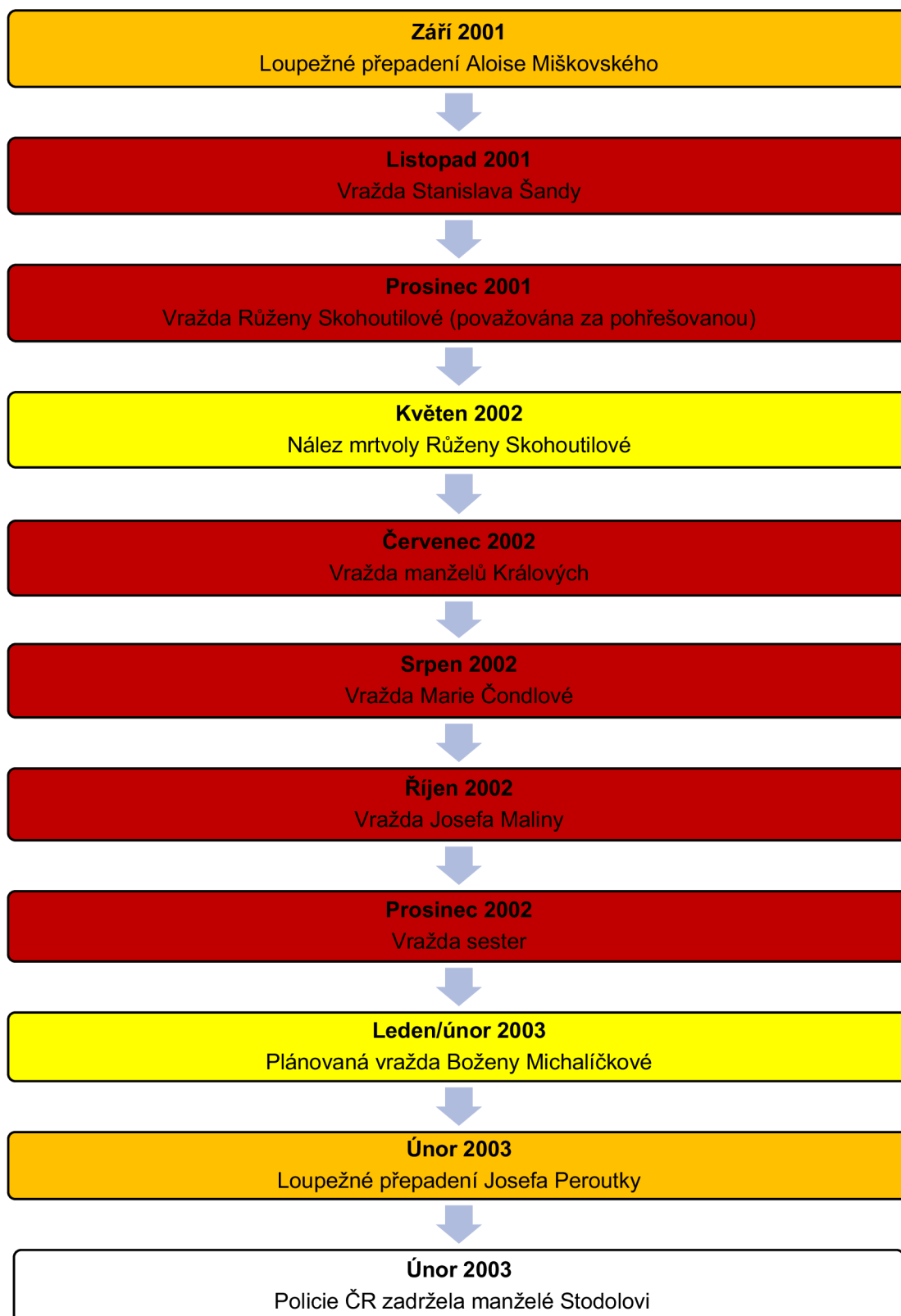
Obr. č. 1.: Graficky znázorněný časový sled vražedné cesty manželů Stodolových