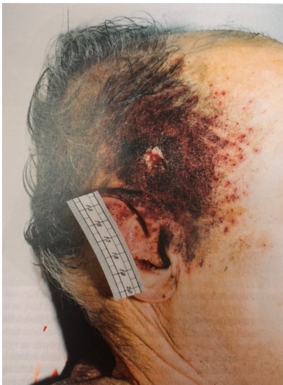
Příloha č.4: Vstřel do spánku, včetně lemu znečištění (zbraní domácí výroby). 143