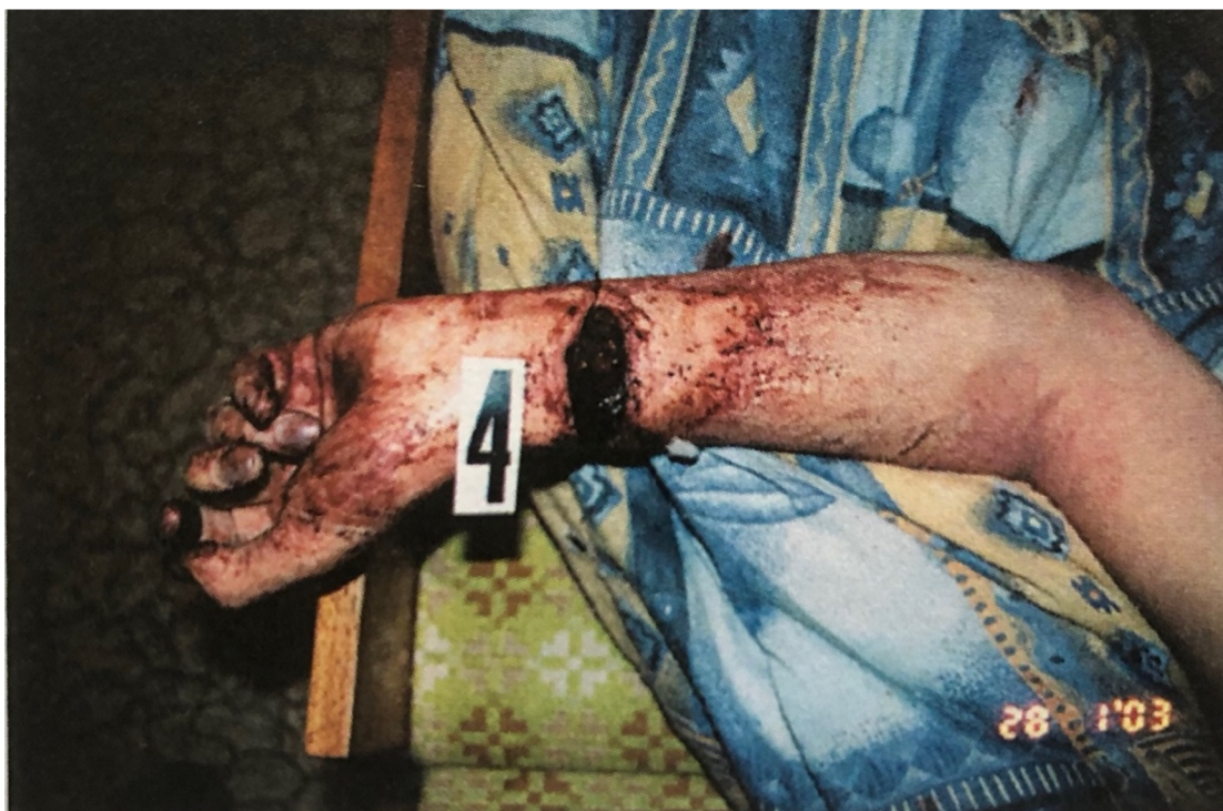
Příloha č. 2: Fotograficky zdokumentované zranění při sebevraždě řeznou zbraní. 141