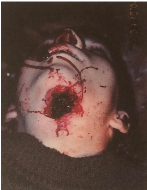
Příloha č.3: Sebevražda střelnou zbraní. 142