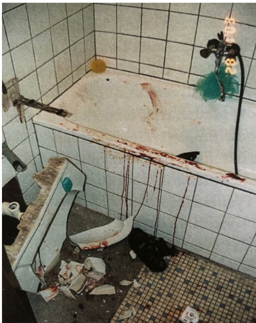
Příloha č.5: Stopy zápasu na místě činu vraždy. 144