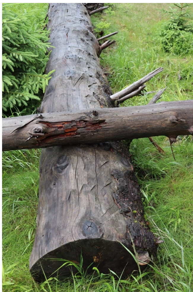
Obrázek 2: Kmen odkorněný pomocí nástavce na motorovou pilu