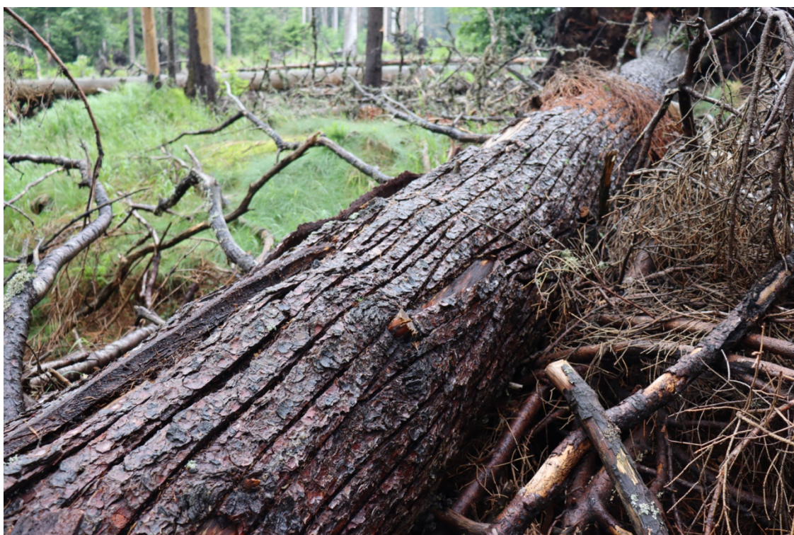
Obrázek 3: Neodvětvený vývrát asanovaný drážkováním

počtu otvorů vytvořených strakapoudy. Ve výsledku lze odkorňováním dosáhnout podobné biologické rozmanitosti jako u neošetřených stromů (Thorn et al. 2016).