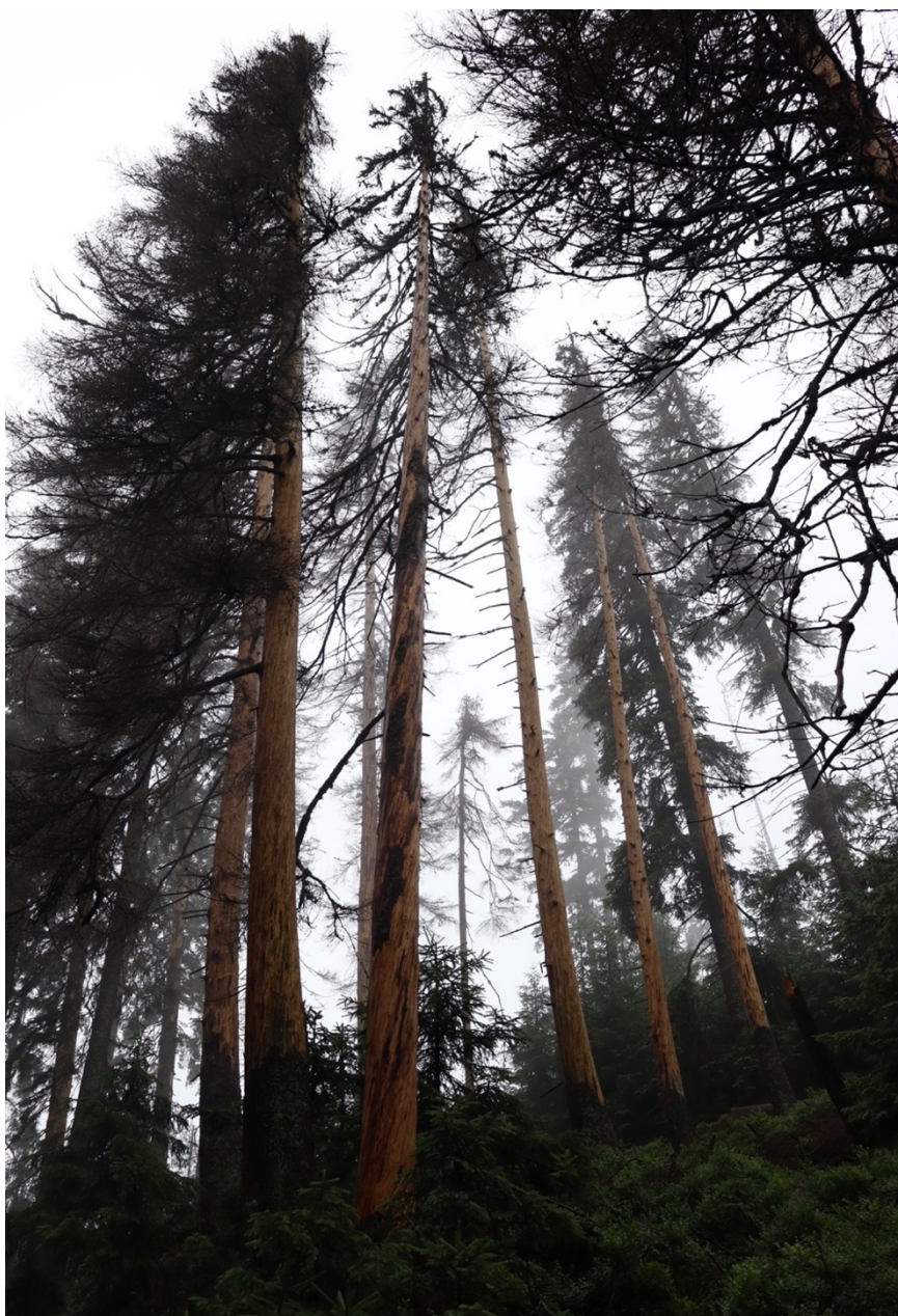
Obrázek 4: odkornění stojících stromů

Výhodou odkorňování stojících stromů je, že nezpůsobují efekt holiny. Ponechané a odkorněné stojící stromy částečně zachovávají mikroklima daného prostředí. Snižují ztrátu půdní vlhkosti vypařováním, v přízemních vrstvách snižují teplotní extrémy a tlumí nárazy větru, čímž chrání okolní stromy před poškozením. Takto odkorněné stromy odumírají a postupně se z nich stávají stojící souše, které jsou oproti zdravým stromům mnohem více náchylné na vyvrácení nebo zlomení. Z tohoto důvodu je nebezpečné tyto stromy ponechávat v okolí turistických stezek a oplocenek, kde mohou způsobit škody nebo zranění. (Havira 2021)