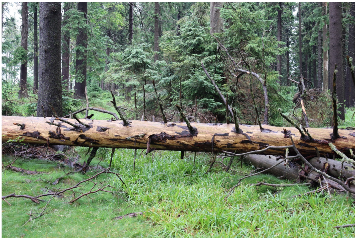
Obrázek 1: Neodvětvený vývrát odkorněný ručním škrabákem