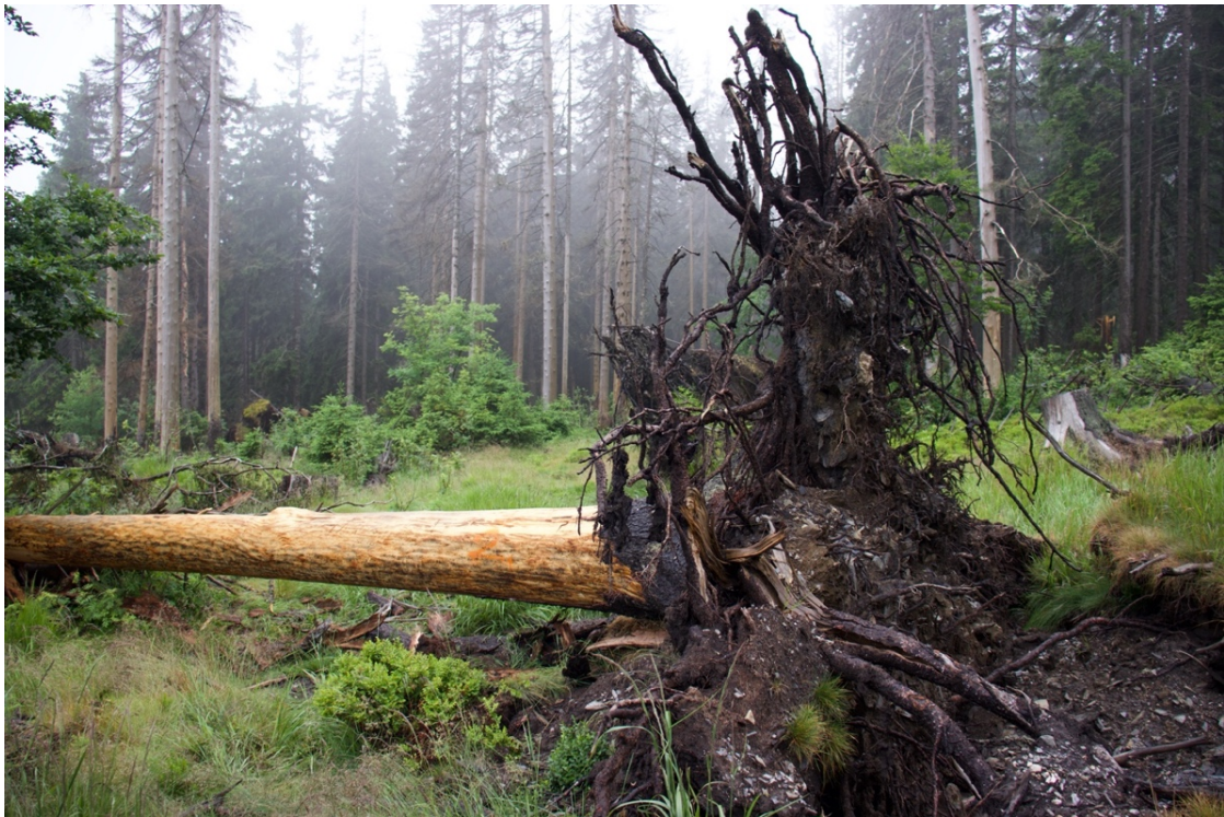
Obrázek 5: Odkorněný vývrát