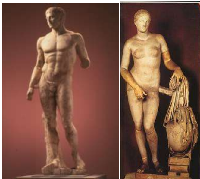
Obr.č.3 Antická žena