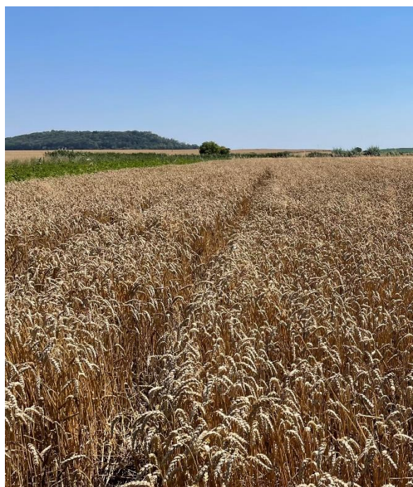
Obrázek č. 7