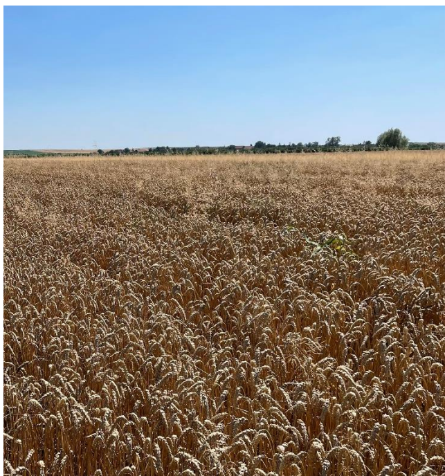
Obrázek č. 6

Tento parametr byl sledován a byl vyhodnocen před sklizní. Pro hodnocení úrovně polehnutí byla použita stupnice od 1 do 4. Stupeň 1 značí situaci, kdy není na poli téměř žádné polehnutí a rostliny si vedou skvěle. Na druhém konci stupnice, stupeň 4, je vysoké procento polehnutých rostlin, což může mít negativní dopad na kvalitu zrna a provedení sklizně. Po pečlivém sledování a vyhodnocení obou variant bylo zjištěno, že v obou případech se polehnutí pohybovalo na stupni 1 až 2. To znamená, že jsme zaznamenali pouze mírné polehnutí rostlin na některých exponovaných místech. Jedním z takových exponovaných míst jsou například souvratě, kde dochází k překryvům při hnojení. V těchto oblastech jsme pozorovali, že rostliny mají mírně větší sklony k polehnutí, což je dáno specifickými podmínkami prostředí a způsobem hnojení. Ukázalo se, že obě řešení vedou k minimálnímu polehnutí a tím pádem k lepší sklizni. Důkazem toho jsou níže vložené obrázky. Kdy na levém obrázku se nachází experimentální varianta a na straně pravé se nachází varianta faremní.