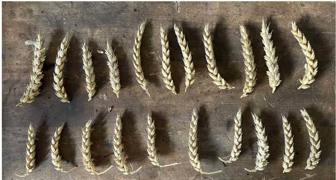
Obrázek č. 5

Co se týče počtu zrn v klasu, ve faremní variantě bylo spčítáno průměrný počet 41 zrn na klas. V experimentální variantě to bylo o něco více - 49 zrn na klas. Na níže vloženém obrázku můžeme porovnat délky klasů obou variant kdy klasy seřazené ve vrchní části obrázku jsou z experimentální varianty a klasy ve druhé řadě jsou z faremní varianty. Již pouhým okem je možné pozorovat rozdílnou délku klasů.