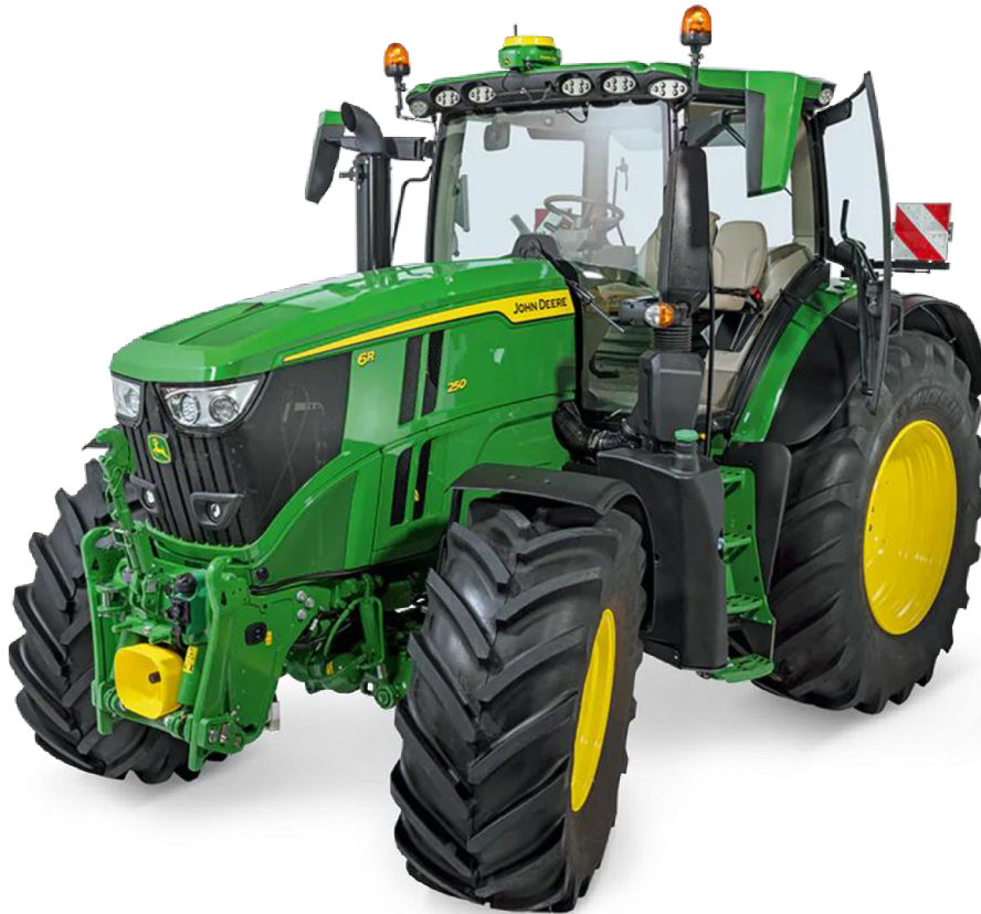
Obrázek 6: John Deere 6R250 [14]

John Deere 6R 250 je nejsilnějším modelem nově představené řady 6R, která disponuje čtrnácti modely v rozsahu od 110 do 250 k jmenovitého výkonu. Zároveň tento model spadá do kategorie s extra velkým rámem, společně s modelem 6R 230. [14]