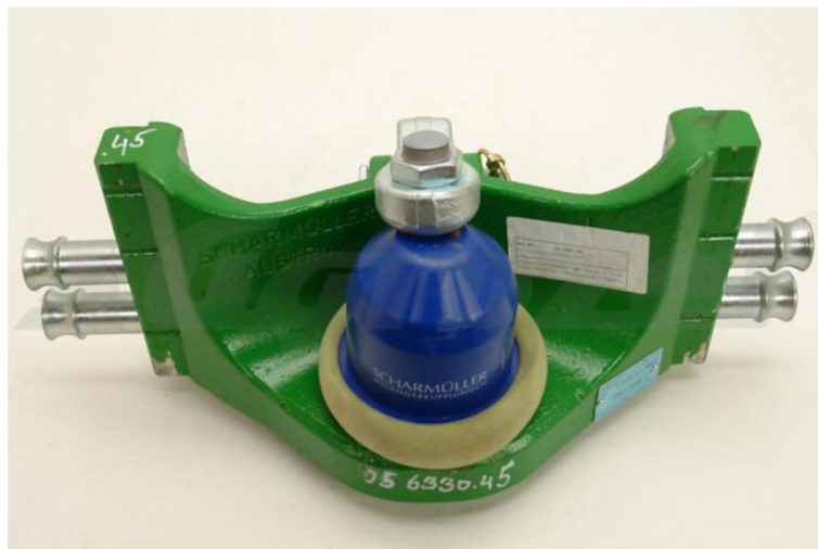
Obrázek 5: Piton Fix (koule) [13]

Druhou skupinou závěsných zařízení jsou spodní závěsy, mezi které patří výkyvný závěs, válečkový výkyvný závěs, pevný závěsný čep (Piton Fix), automatický agrozávěs a etážový závěs. Dnes nejvyužívanější je etážový závěs s automatickou hubicí a Piton Fix (nejčastěji tvořen koulí). [1]