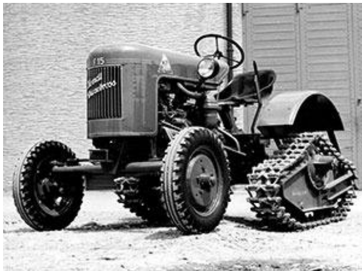
Obrázek 1: Historický traktor Fendt [9]

žací lištou a motorem Deutz o výkonu 2,9 kW. Motory značky Deutz používá firma Fendt do svých traktorů dodnes, ale již s výkony přesahujícími 300 koní. Po celou dobu své existence si Fendt vyráběl převodovky do svých traktorů sám. V roce 1996 představil ve světě zemědělské techniky velmi známou převodovku Vario s plynulým pojezdem. Tuto převodovku dnes vyrábí Fendt ve třech provedení a montuje ji do čtyř řad svých traktorů.[6]