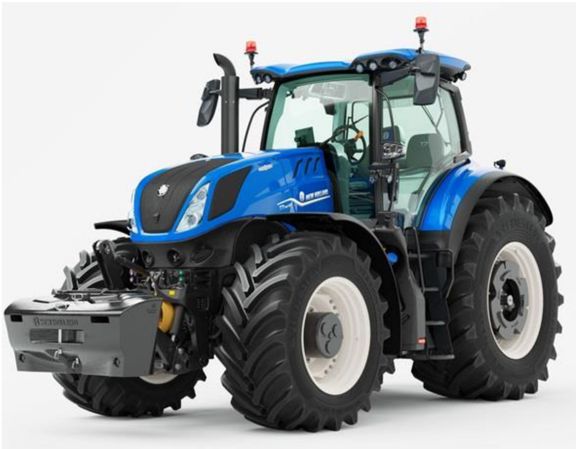
Obrázek 8: New Holland T7.260 [16]

Řada traktorů New Holland T7 je rozdělena ještě do tří podskupin, kdy autorem vybraný model T7.260 spolu s dalšími pěti modely spadá do skupiny s dlouhým rozvorem. Do této řady spadají traktory výkonu od 190 k do 160 k. [16]