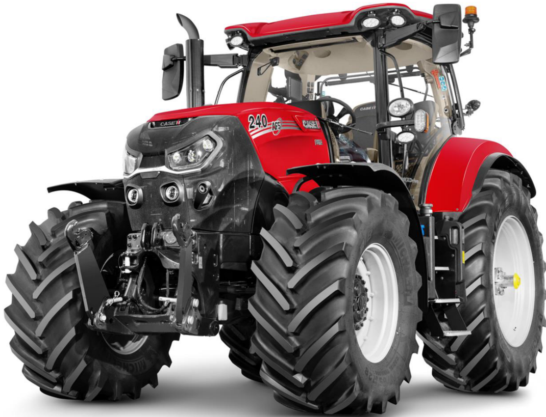
Obrázek 10: Case Puma 240 [18]

Řada Case Puma zahrnuje celkem devět modelů, které jsou rozděleny do dvou kategorií. Do kategorie „malá“ Puma (140–175 k) a do kategorie „velká“ Puma (185–240 k), kam spadá i autorem vybraným model, který je zároveň v této kategorii nejsilnější. [18]