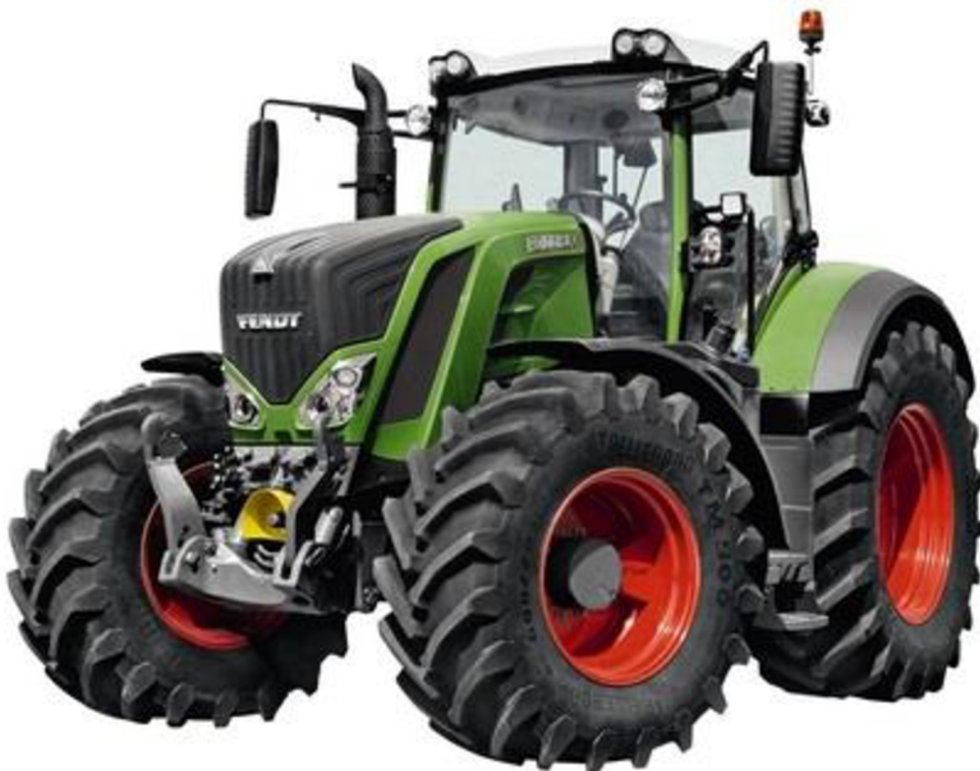
Obrázek 9: Fendt 824 Vario [17]

Tento model spadá společně s dalšími třemi do řady Fendt Vario 800, kam patří modely výkonové třídy od 226 k do 287 k jmenovitého výkonu. Traktory vyššího výkonu již spadají do řady 900 Vario nebo ty největší do řady 1000 Vario. [17]