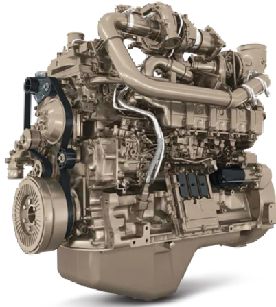
Obrázek 2: Motor John Deere [11]

V dnešní době jsou u traktorů využívány převážně čtyřdobé vznětové motory, kromě výjimek, které tvoří pouze některé malotraktory. Čtyřdobé vznětové motory jsou pístové motory s vnitřním spalováním, kde se energie přenáší přes píst a ojnici na klikový hřídel. [1]