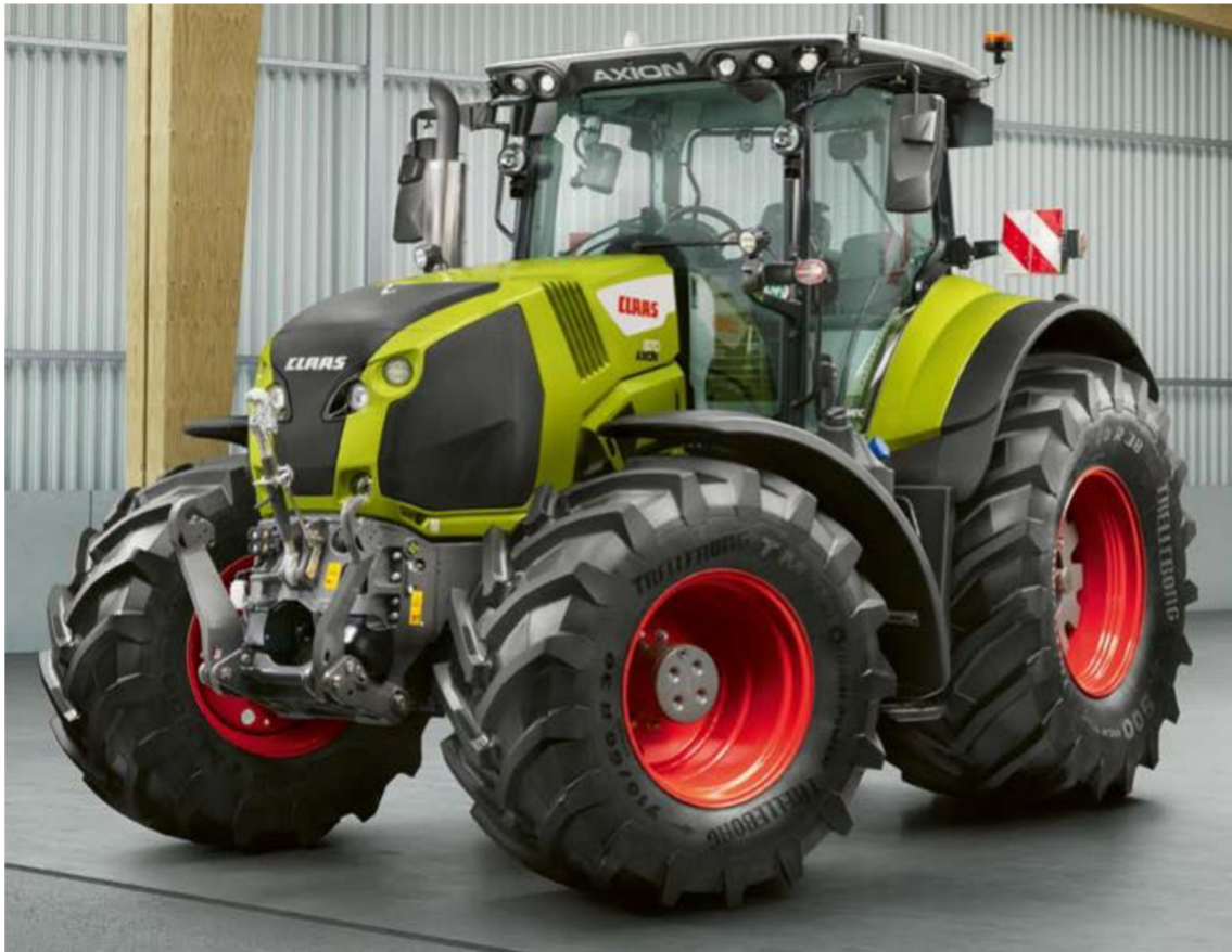
Obrázek 7: Claas Axion 850 [15]

Tento traktor spadá společně s dalšími čtyřmi modely do řady Axion 800, kam patří traktory výkonové třídy od 194 k do 270 k jmenovitého výkonu. Modely s výkonem nad 270 k již spadají do silnější řady Axion 900. [15]