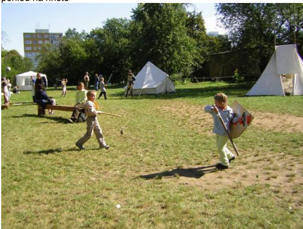
pohled na hřiště z druhé strany