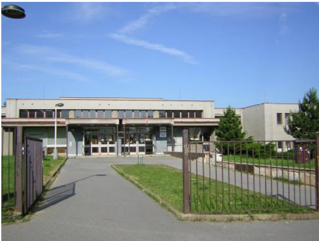
pohled na budovu ZŠ Písnická