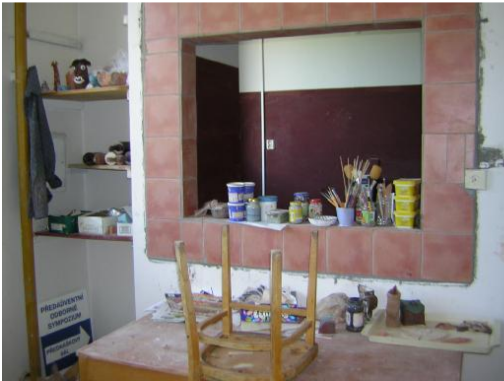
keramická dílna ZŠ Písnická