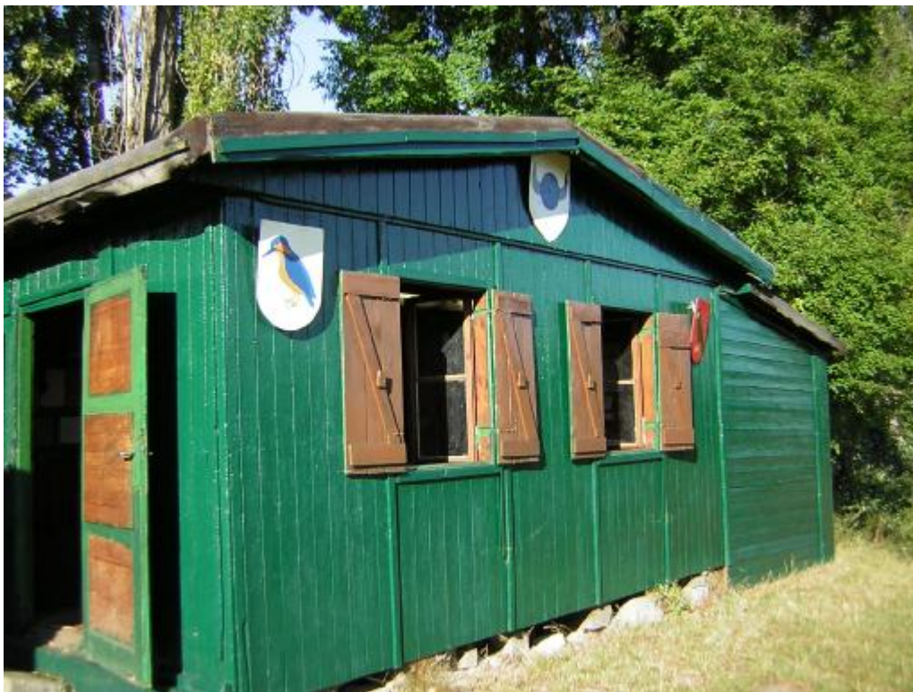
jedna z kluboven 34. střediska Ostříž