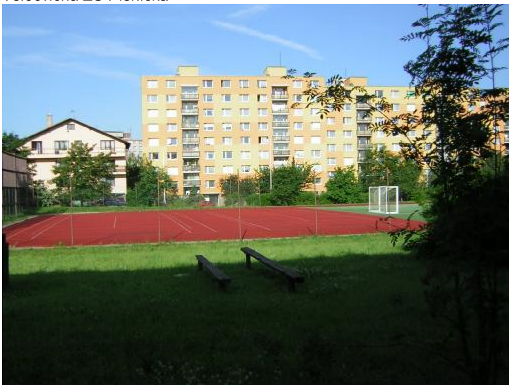
Hřiště ZŠ Písnická