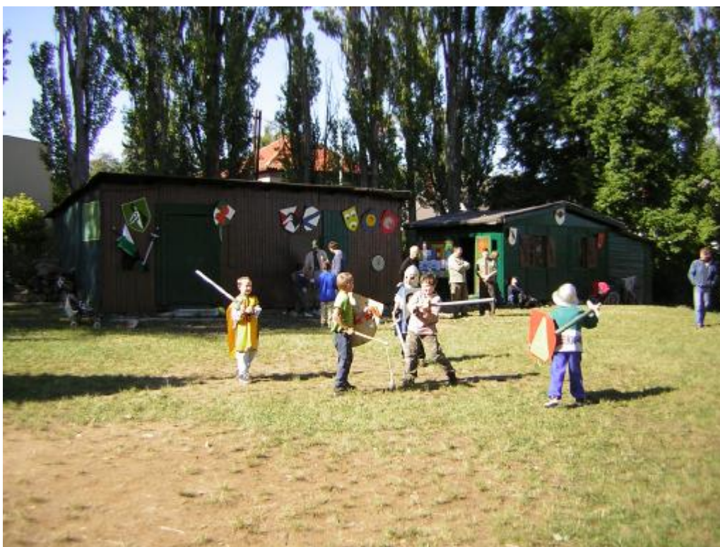
pohled na hřiště