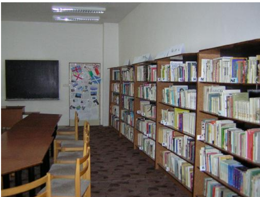
Knihovna ZŠ Písnická