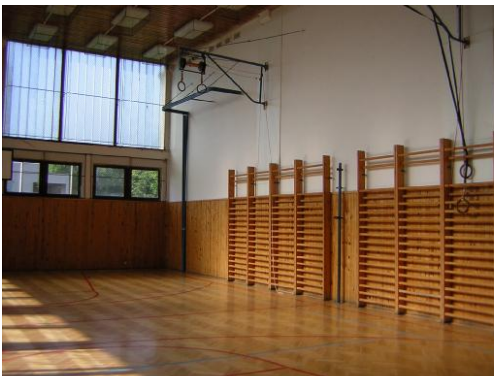
Tělocvična ZŠ Písnická