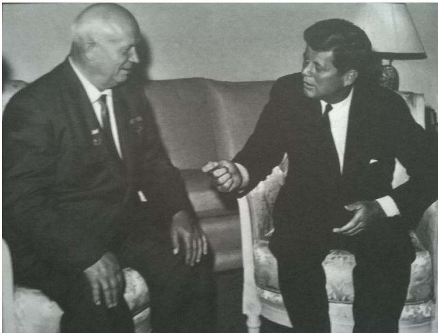
Zdroj: Pacner, K.: Osudová třináctka