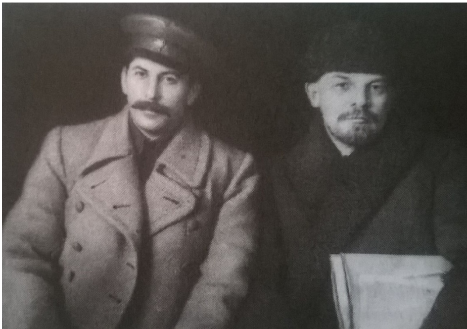
Obr. č. 2: Josif Stalin a Vladimír Iljič Lenin