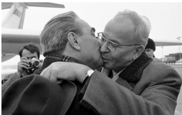
Obr. č. 8: Typický pozdrav, zde s Gustavem Husákem