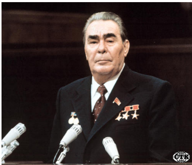
Obr. č. 7: Leonid Iljič Brežněv