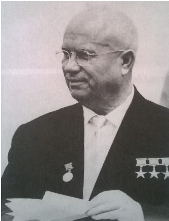
Zdroj: Pacner, K.: Osudová třináctka