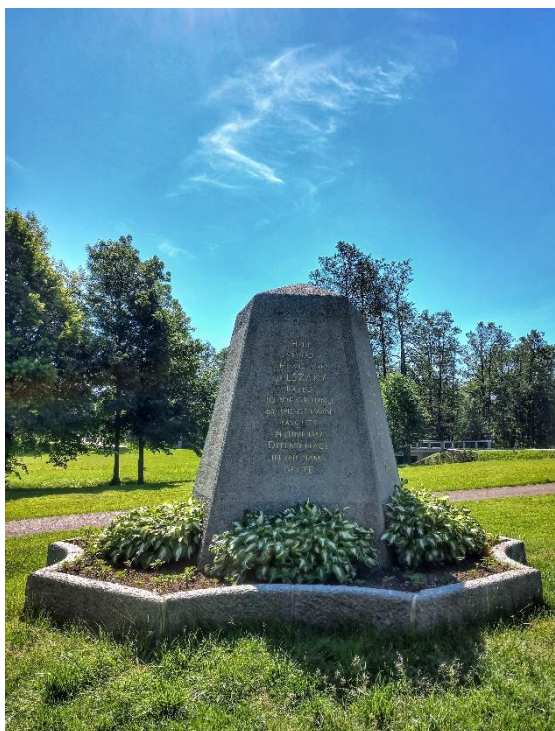
Příloha č. 13: Národní kulturní Památník v Ležákách.