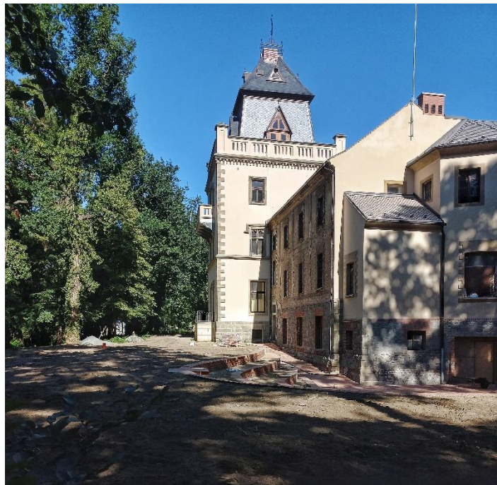
Příloha č. 19: Larischova vila v Pardubicích.