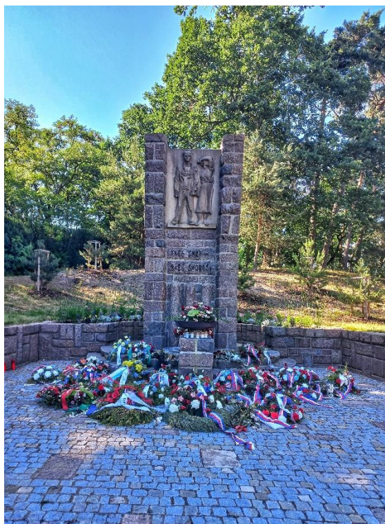
Příloha č. 18: Památník Zámeček v Pardubicích.