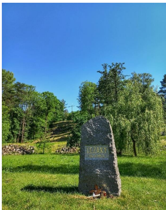
Příloha č. 14: Národní kulturní Památník v Ležákách.