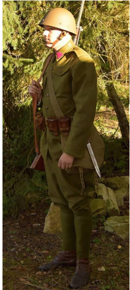
Abb. 11 Darstellung eines Infanteristen der tschechoslowakischen Armee (Wehrmacht) im Jahr 1938