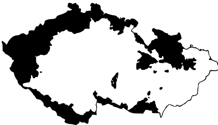
Abb. 1 Deutsche Provinzen auf dem Gebiet der heutigen Tschechischen Republik

Für eine bessere Vorstellung füge ich auch noch eine Landkarte mit den gerade genannten Gebieten bei. Obwohl ich die zitierte „freie Enzyklopädie Wikipedia“ nicht für besonders geeignet halte, die Beschreibung der Provinzen und die Landkarte halte ich für passend und ausreichend zum Zweck dieser Arbeit.