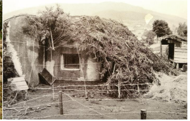
Abb. 7 das Aussehen eines Objekts des „neuen Modells“ im Böhmerwald im Jahr 1938 (aus: Mit dem VII. Korps ins Sudetenland)