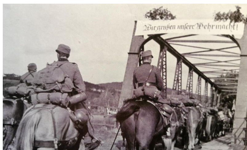
Abb. 2 ein Bild aus dem Jahr 1938, das die Ankunft der Wehrmachtstruppen zeigt (aus: Mit dem VII. Korps ins Sudetenland)