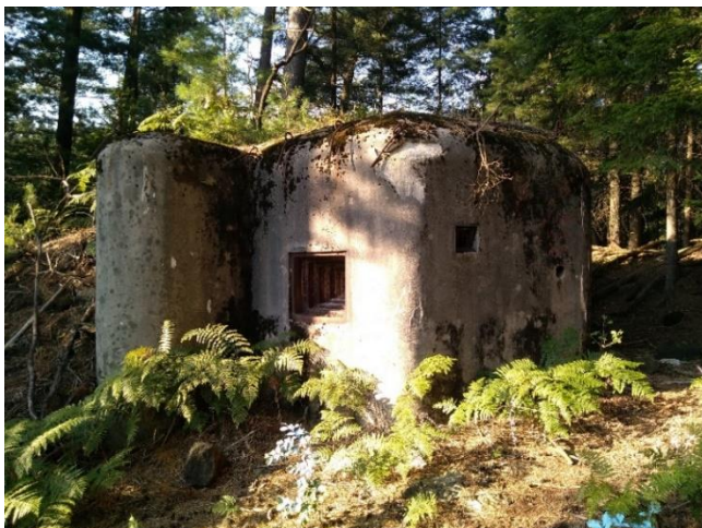
Abb. 8 heutiges Aussehen eines Objekts des „neuen Modells“

Das Ende der ersten Phase, die dann schon eine relativ effektive Verteidigung mithilfe der Befestigung ermöglichen sollte, wurde für das Jahr 1941, bzw. 1942 geplant. Die unmittelbare Bedrohung eines Krieges kam aber viel früher, und obwohl sich der Ausbau in den