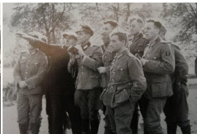
Abb. 3 ein Bild aus dem Jahr 1938, die Originallegende lautet: „Die Bunkerlinie wird erklärt“ (aus: Mit dem VII. Korps ins Sudetenland)