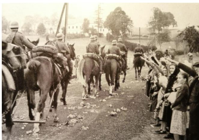
Abb. 2 ein Bild aus dem Jahr 1938, das die Ankunft der Wehrmachtstruppen und ihre Begrüßung zeigt (aus: Mit dem VII. Korps ins Sudetenland)

Geplant und durchgeführt wurde die Besetzung mithilfe der deutschen Wehrmacht gleich in den ersten Oktobertagen, wobei die kommenden deutschen Truppen begrüßt und gejubelt wurden.