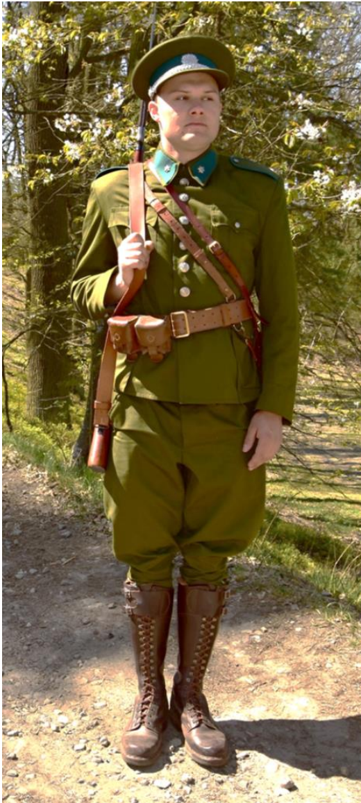
Abb. 10 Darstellung eines Angehörigen der Finanzwache im Jahr 1938

Abkommen“ das Grenzgebiet verließen, waren nicht sicher und wurden überall von der neuen Staatsmacht im Protektorat Böhmen und Mähren gefunden und schwer bestraft.