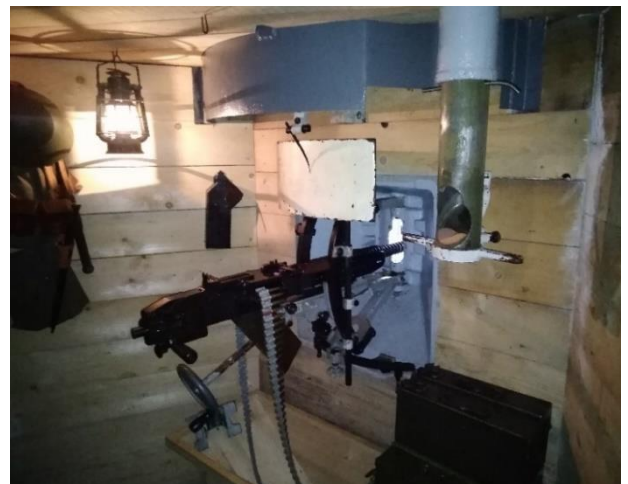
Abb. 9 Der Idealzustand eines ausgestatteten Objekts des „neuen Modells“