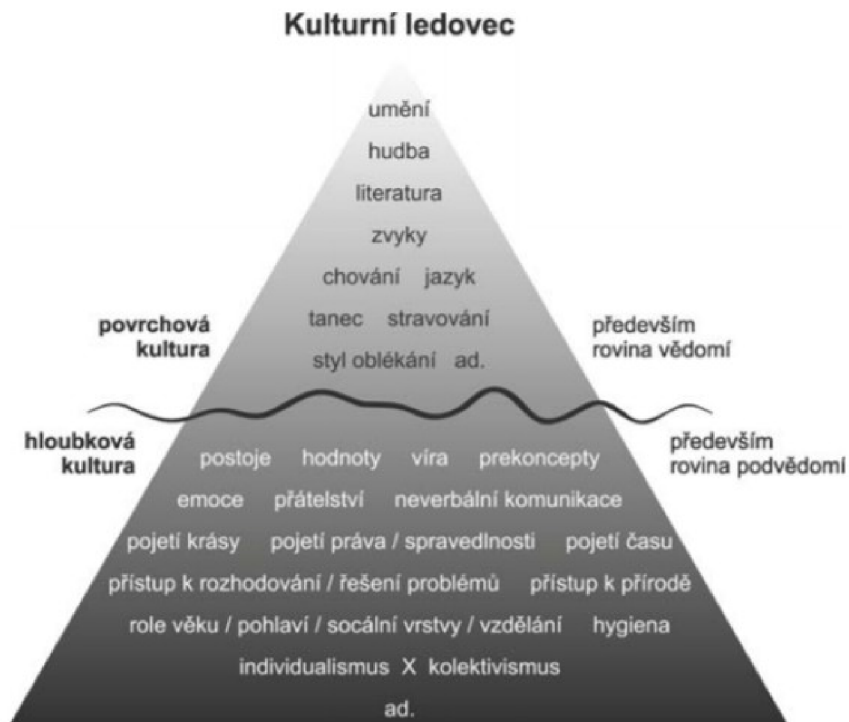
Obrázek I: Kulturní ledovec [Kostková 2012: 15]