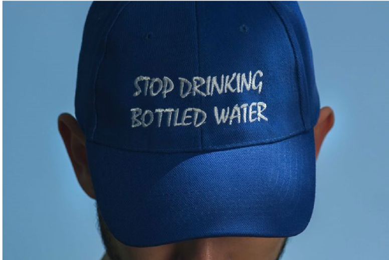
(22) RADEK BROUSIL