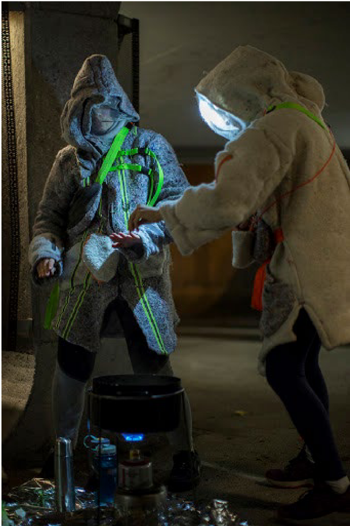
(9) STONY TELLERS