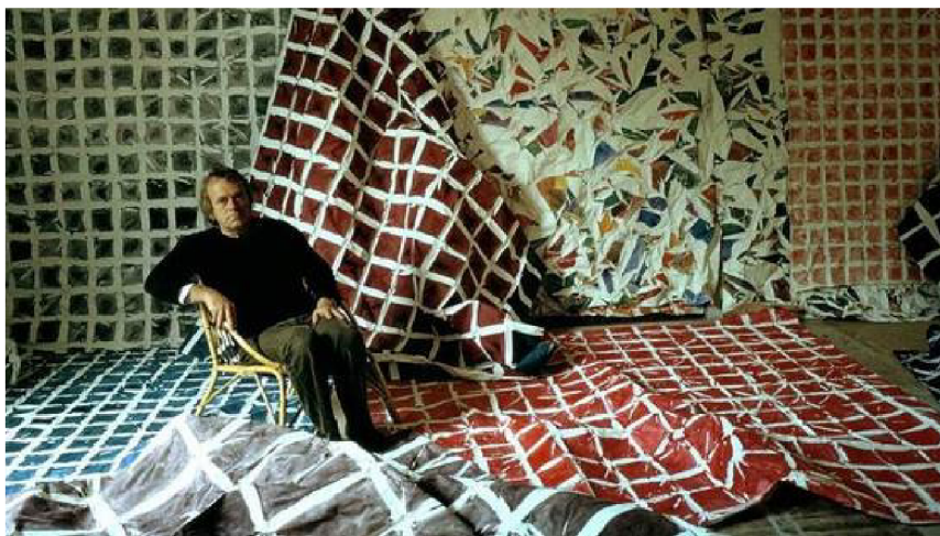
(40) SIMON HANTAI