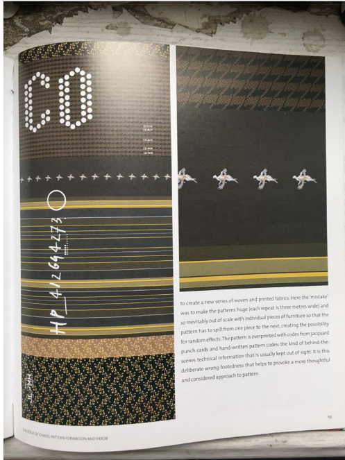
(13) HELLA JONGERIUS & TOD BOONTJE