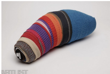
(39) ADÁLA SVOBODOVÁ