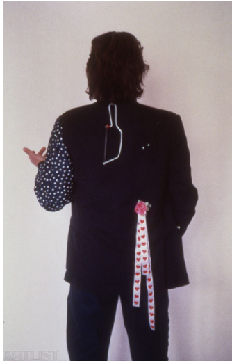
(1) MILAN KNÍŽÁK