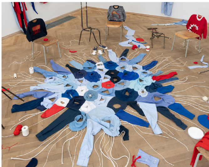
(6) EVA KOŽÁTKOVÁ