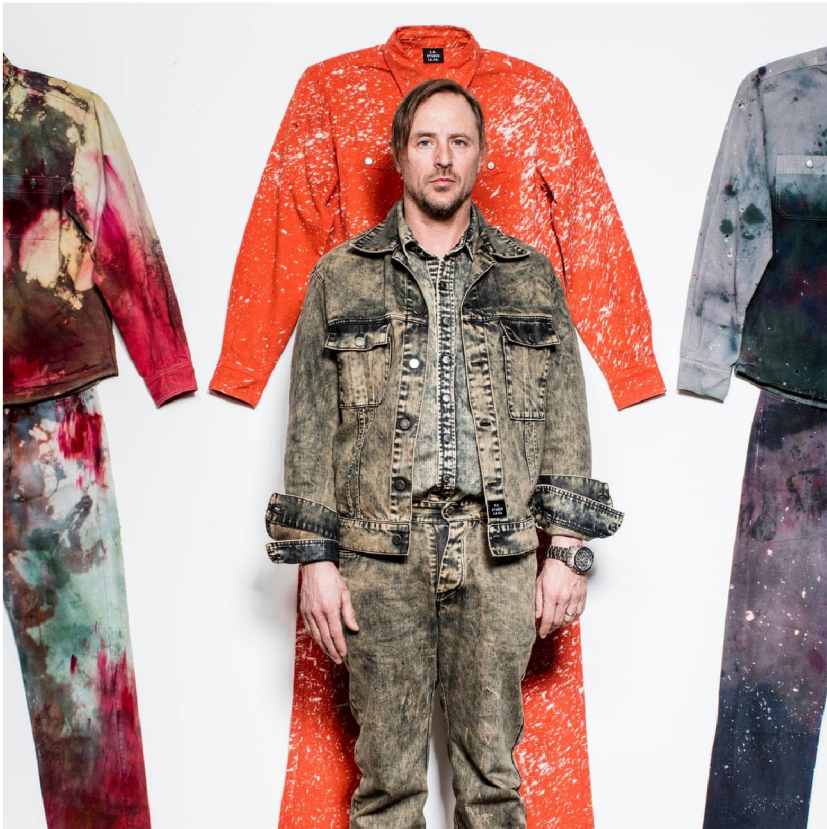
(20) STERLING RUBY