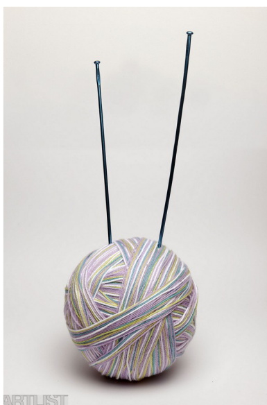
(36) ADÉLA SVOBODOVÁ

https://yudex.xyz/ - vyměnit fotky - instalace