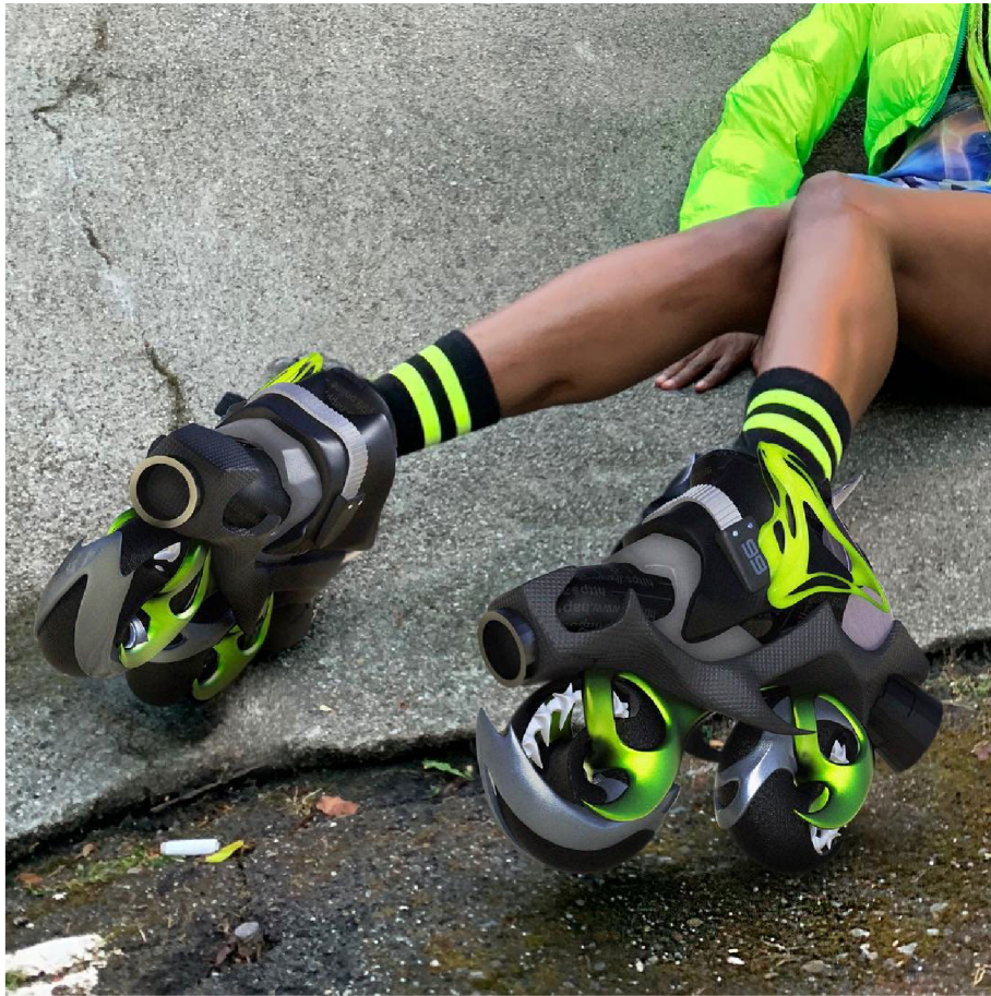
(46) HAPPY 99