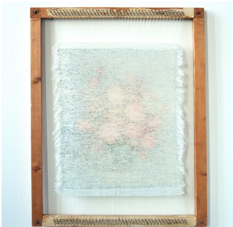
(42) ANETA DOVOŘÁKOVÁ