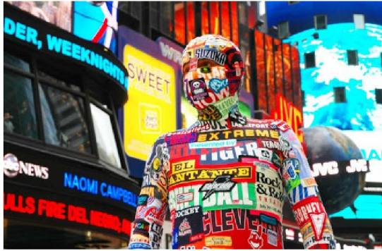
(4) JIŘÍ ČERNICKÝ