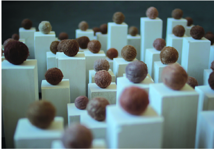
(37) ANETA DVOŘÁKOVÁ