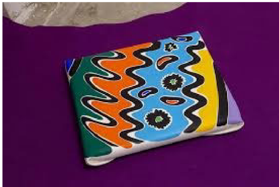
(33) ALŽBĚTA KRŇANSKÁ