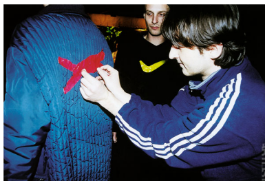
(15) KAMERA SKURA