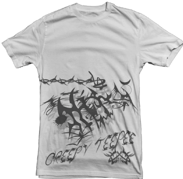
(34) CREEPY TEEPEE