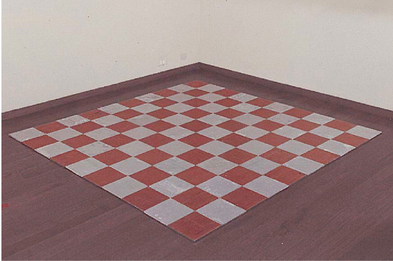
(43) CARL ANDRE