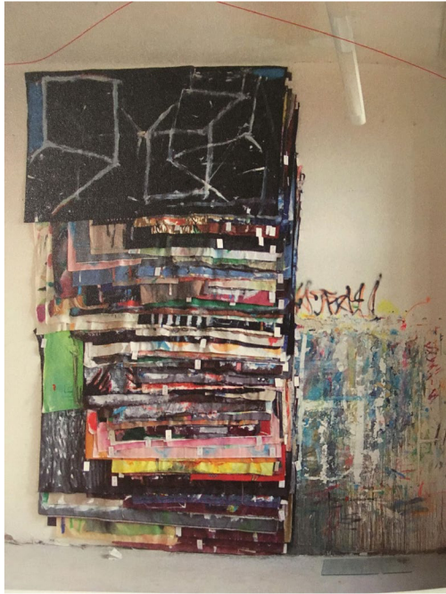
(27b) JULIUS RAICHEL