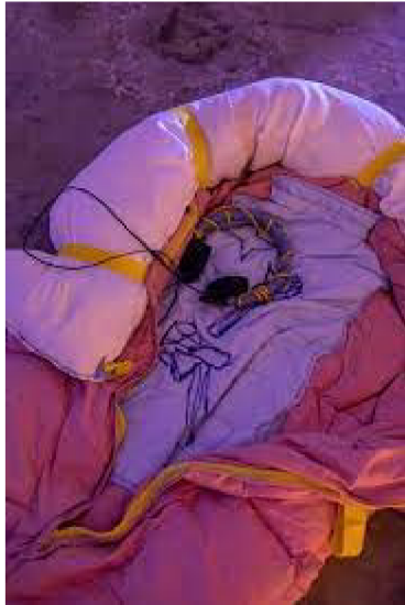
(25) TEREZA VINKLÁRKOVÁ