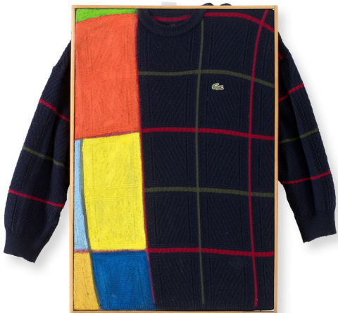
(27a) JULIUS RAICHEL