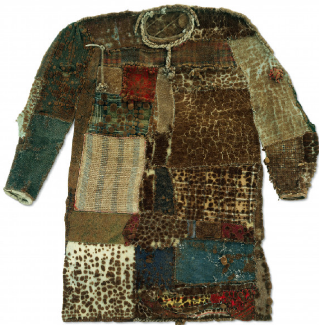
(3) FRANTIŠEK SKÁLA