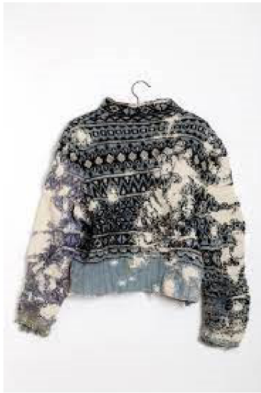
(17) CELIA PYM