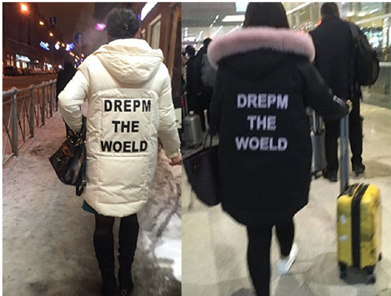
(14) SHANZHAI LYRIC