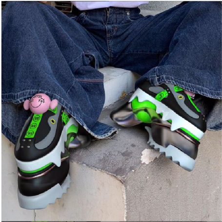
(44) HAPPY 99