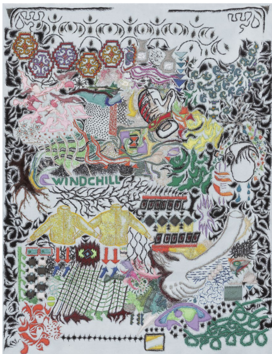
(35) FLEECE+LARISA, 2021

https://yudex.xyz/ - vyměnit fotky - instalace