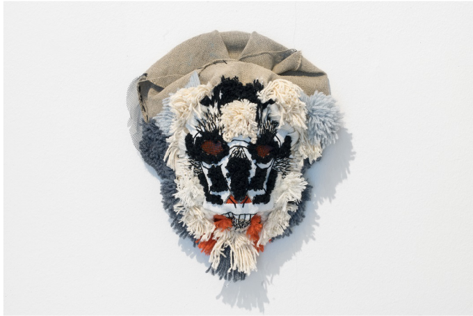
(32) MICHAL NOSEK