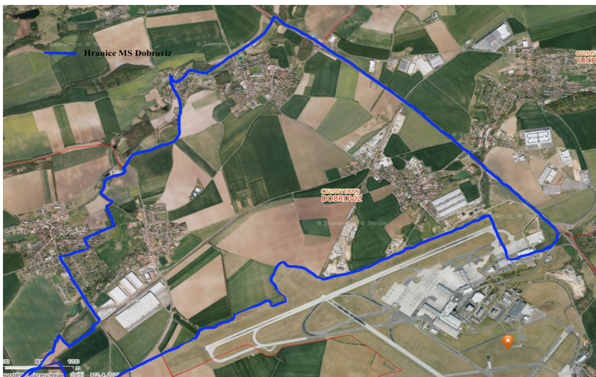
Obrázek 1: Hranice honitby MS Dobrovíz