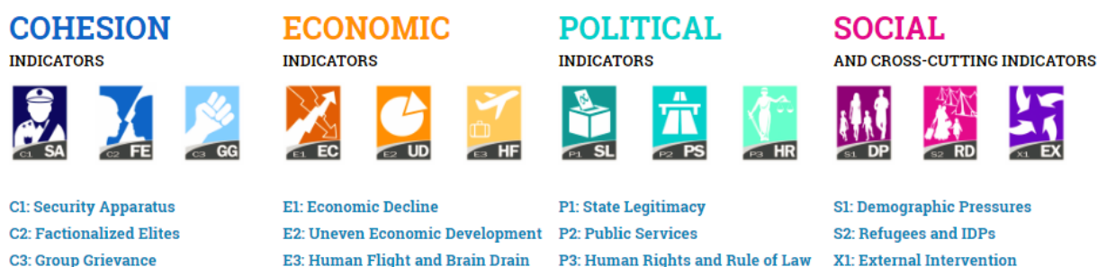
Obrázek 2. Schéma indikátorů Fragile States Indexu