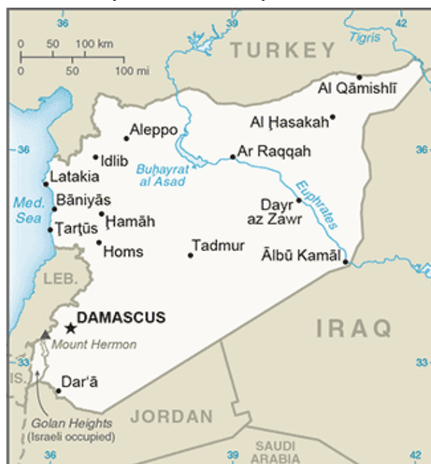
Obrázek 1. Syrská arabská republika

Hlavním městem Sýrie, oficiálním názvem Syrská arabská republika, je Damašek nacházející se na jihozápadě země. Rozloha Sýrie je 185 180 km 2 (183 630 km 2 pevniny a 1 550 km 2 teritoriální vody) 5 . Počet obyvatel je k roku 2017 6 18 028 549. Úředním jazykem je arabština, dalšími jazyky jsou kurdština, arménština, aramejšťina, čerkeština, francouzština a angličtina. Sýrie se nachází na Blízkém východě u pobřeží Středozemního moře. Sousedními zeměmi jsou Turecko, Irák, Jordánsko, Izrael a Libanon (The World Factbook, 2018).