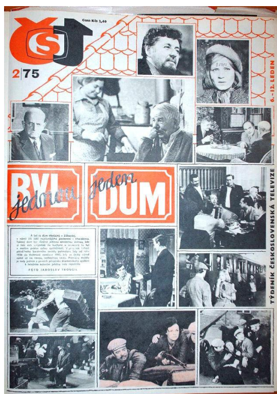
Obrázek 1: Titulní strana týdeníku Česká televize