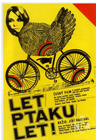
Obrázek 3: Plakát k filmu Let', ptáku, let'!