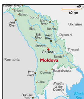
Obr. 5: Lokace projektu