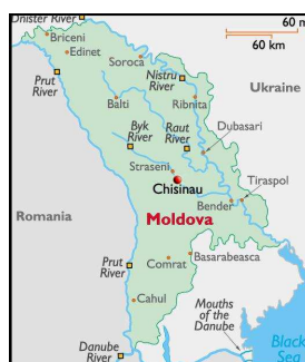
Obr. 6: Lokace projektu