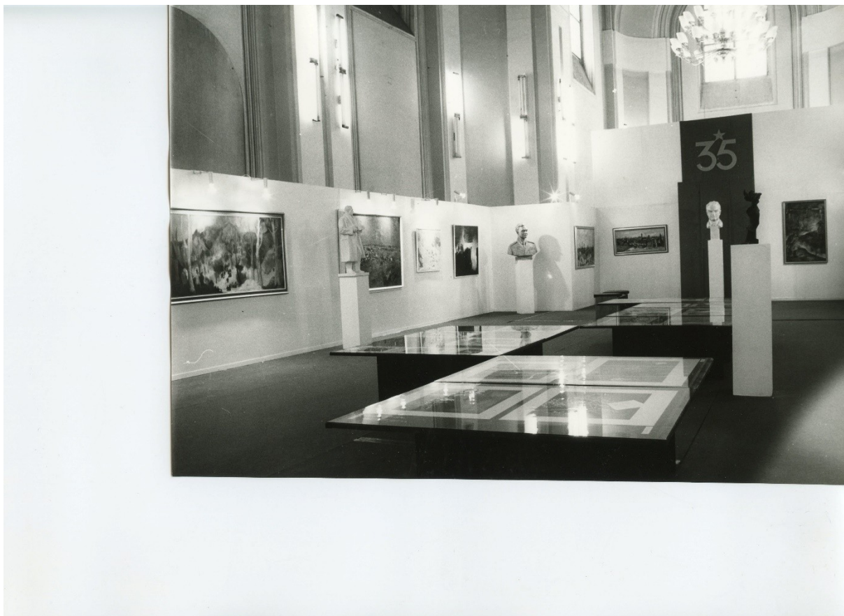
Obrázek 1 Fotografie výstavní síně při výstavě Výtvarní umělci Severomoravského kraje k 35. výročí osvobození Československa sovětskou armádou (1980)