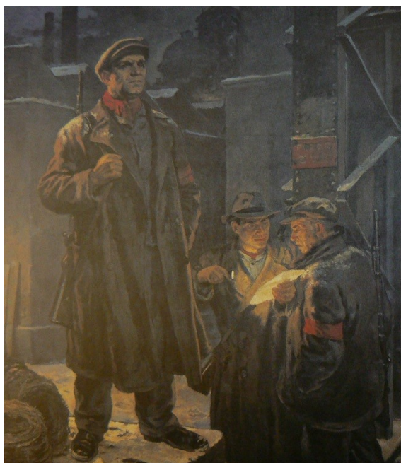
[1] Jan Čumpelík, Na úsvitu únorového dne , 1950.

(vzhledem k ostatním produkci západního světa). 59 Vidíme zde „adorování“ formy socialistického realismu oproti jiným výrazovým prostředkům.