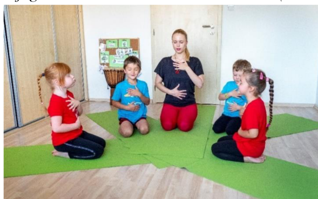
Dětská jóga v mateřské škole – dechové cvičení