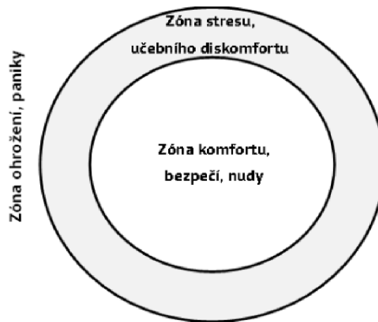
Obrázek 2 Teorie komfortní zóny

při jiných podmínkách, jinak náročném programu, za jinak náročných situací. V prostoru zóny učení (nebo také zóny stresu, učebního diskomfortu) se můžeme mnoho dozvědět o sobě, svých osobních intimních procesech a svém fungování v různých situacích, což někdy mohou doprovázet pocity nejistoty a nestability i pocity opravdového strachu (Jirásek, 2019).