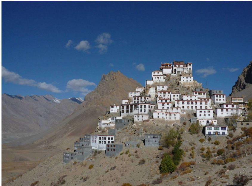
Key Gompa v Himachal Pradesh, Indie.