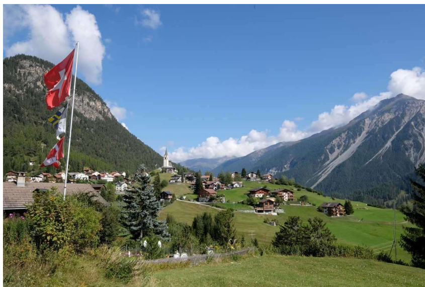
Graubünden, Švýcarsko.

Tradiční architektura v horských oblastech Indie a Švýcarska názorně demonstruje, jak lze pomocí vhodné integrace architektury harmonicky rozvíjet krajinný ráz.