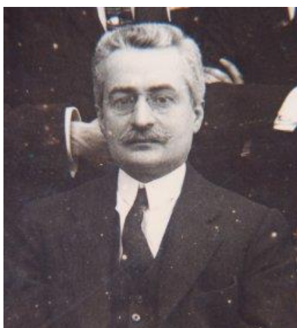
Obrázok 3 192