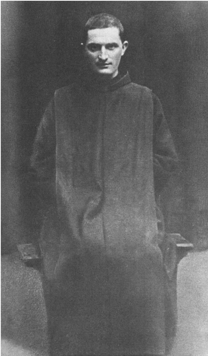
Obrázok 5 194