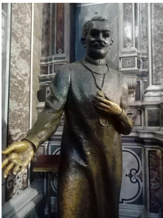
Obrázok 4 193