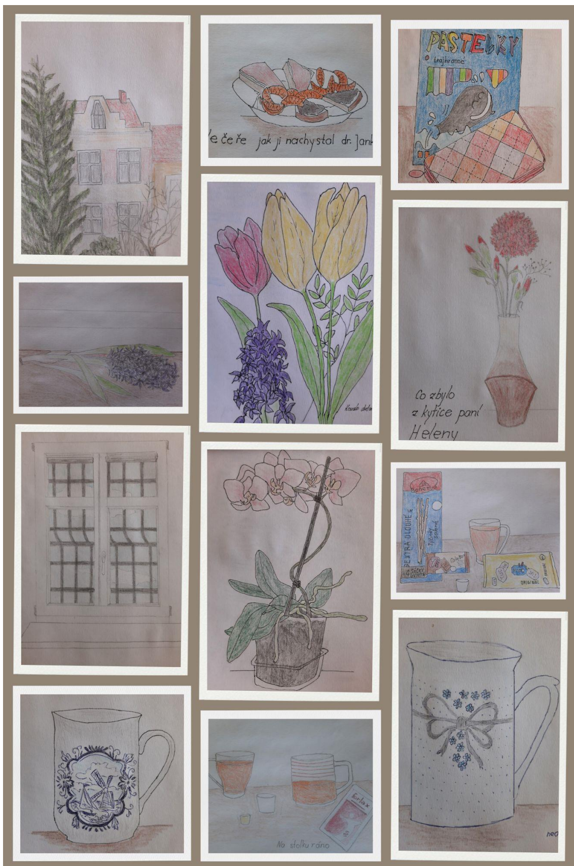
Obrázok 6 195