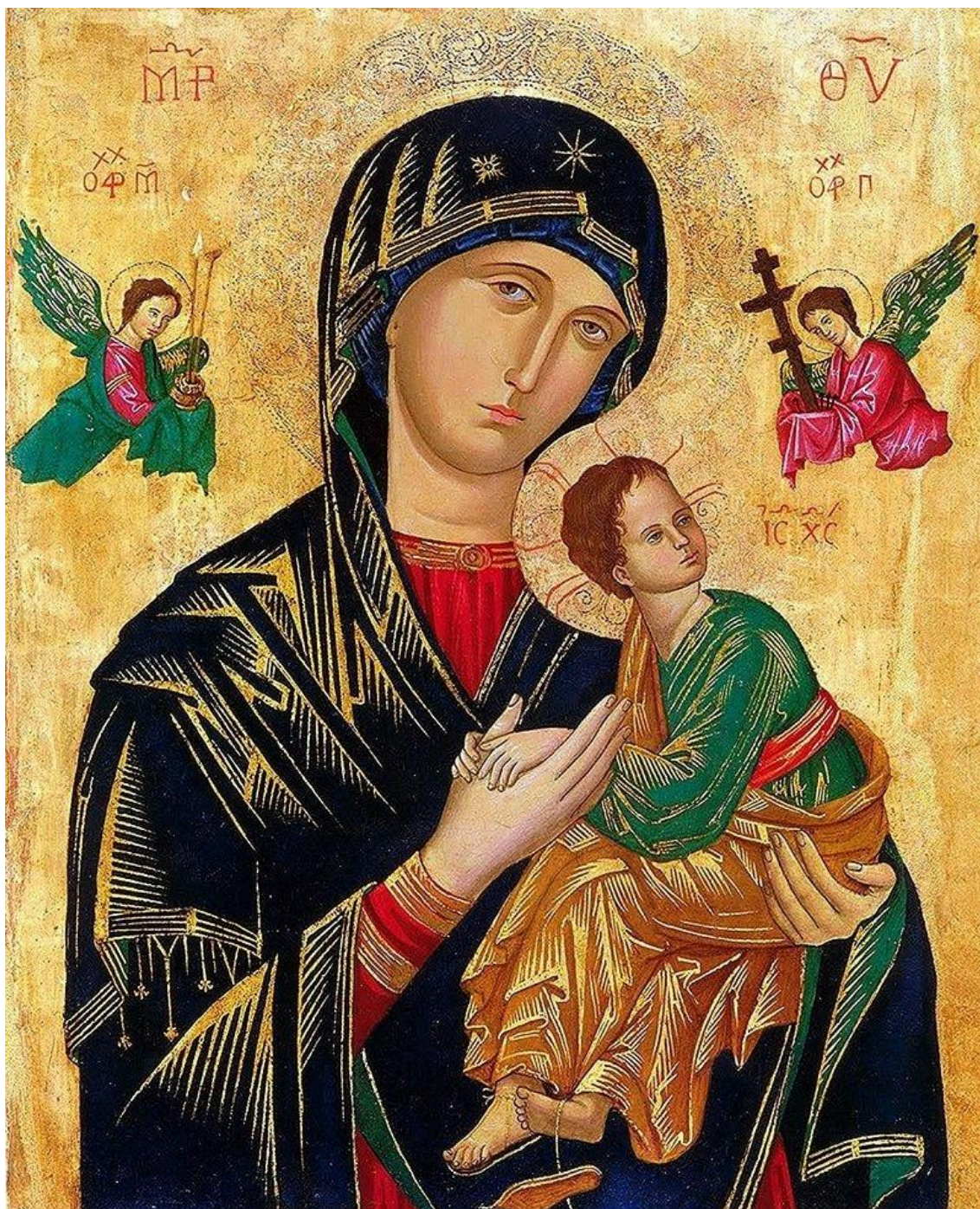
Obrázok 1 190