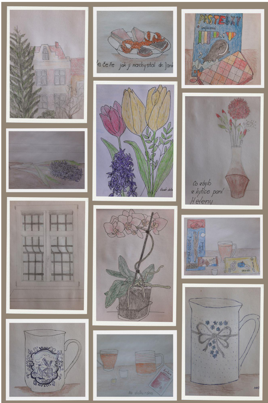
Obrázok 6 195