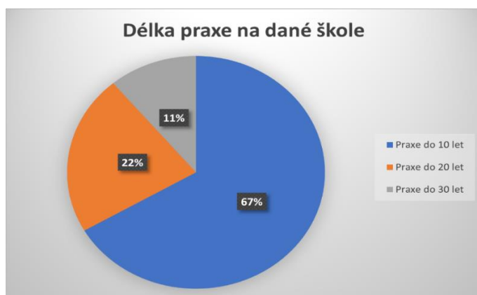
Graf 2: Délka praxe na dané škole