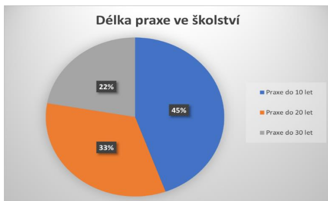
Graf 1: Délka praxe ve školství