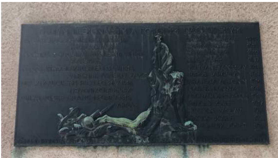
Obrázek 1: Pamětní deska.