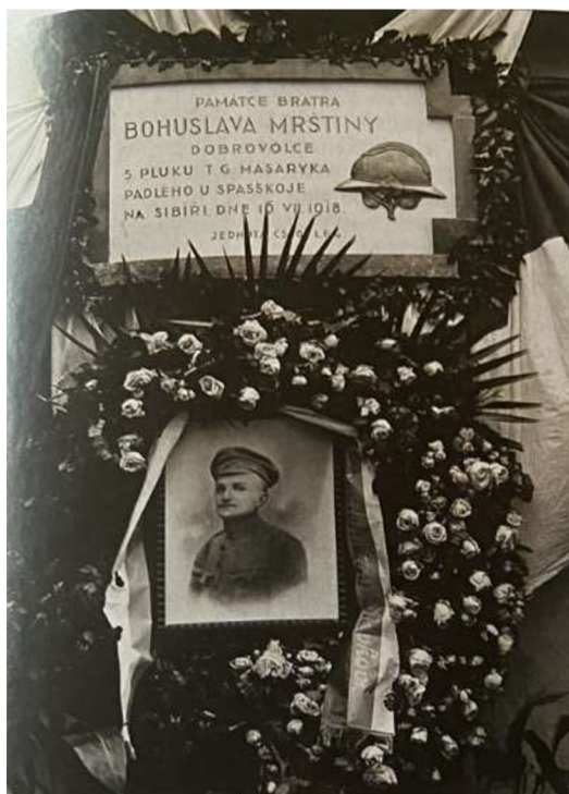
Obrázek 3: Pamětní deska na rodném domě 23