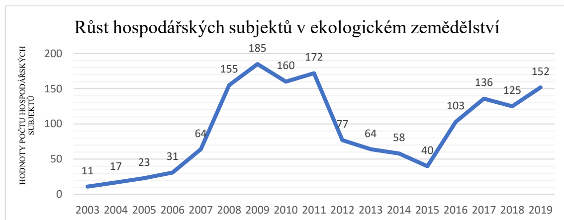
Obrázek 6: Graf znázorňující počet hospodářských subjektů v ekologickém zemědělství v letech 2003-2019

Zdroj dat: Bulletin on organic agriculture in the Republic of Moldova 2020, vlastní zpracování