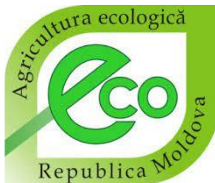
Obrázek 3: Agricultura ecologică logo, ochranná známka pro biopotraviny původem z Moldavska

Zákon odkazuje na pojmy „ekologický“, „biologický“ a „organický“, ale explicitně nezakazuje použití těchto termínů i pro konvenční produkty, proto můžeme v Moldavsku vidět část necertifikovaných produktů nést tato označení a není ojedinělé, že někteří dodavatelé chemických pesticidů používají internetovou adresu organic.md bez očividných dopadů. Tento problém následně vede k nedůvěře a ztrátě zájmu konečných konzumentů, jelikož jsou vlastně zahlceni falešnými produkty se zavádějícím názvem. ASP 10 , které registrují firmy a AGEPI 11 , které zase registrují jméno značky dle všeho nejsou vázány zákonem 115/2005 (Arndt a Lozan 2020).