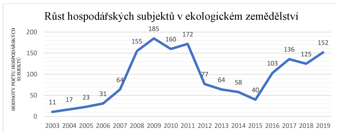
Obrázek 6: Graf znázorňující počet hospodářských subjektů v ekologickém zemědělství v letech 2003-2019

Zdroj dat: Bulletin on organic agriculture in the Republic of Moldova 2020, vlastní zpracování