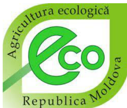
Obrázek 3: Agricultura ecologică logo, ochranná známka pro biopotraviny původem z Moldavska

Zákon odkazuje na pojmy „ekologický“, „biologický“ a „organický“, ale explicitně nezakazuje použití těchto termínů i pro konvenční produkty, proto můžeme v Moldavsku vidět část necertifikovaných produktů nést tato označení a není ojedinělé, že někteří dodavatelé chemických pesticidů používají internetovou adresu organic.md bez očividných dopadů. Tento problém následně vede k nedůvěře a ztrátě zájmu konečných konzumentů, jelikož jsou vlastně zahlceni falešnými produkty se zavádějícím názvem. ASP 10 , které registrují firmy a AGEPI 11 , které zase registrují jméno značky dle všeho nejsou vázány zákonem 115/2005 (Arndt a Lozan 2020).