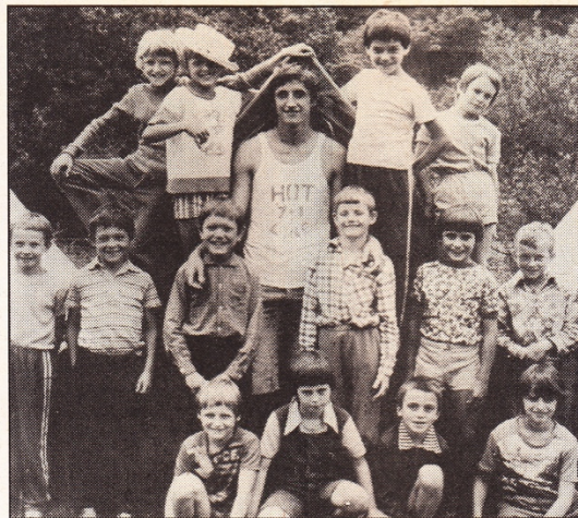
Moje heslo bylo a je: Nad nikoho se nepovyšuj, před nikým se neponižuj