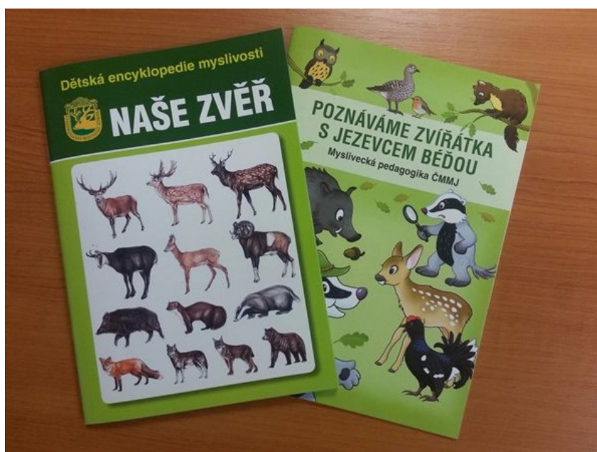
Obrázek 1: Dětské brožury myslivecké pedagogiky 34

V posledním roce (2015) vyšly brožury zabývající se mysliveckou pedagogikou pod záštitou Českomoravské myslivecké jednoty Dětská encyklopedie myslivosti: „Naše zvěř“ a „Poznáváme zvířátka s jezevcem Bédou“ (viz Obrázek 1).