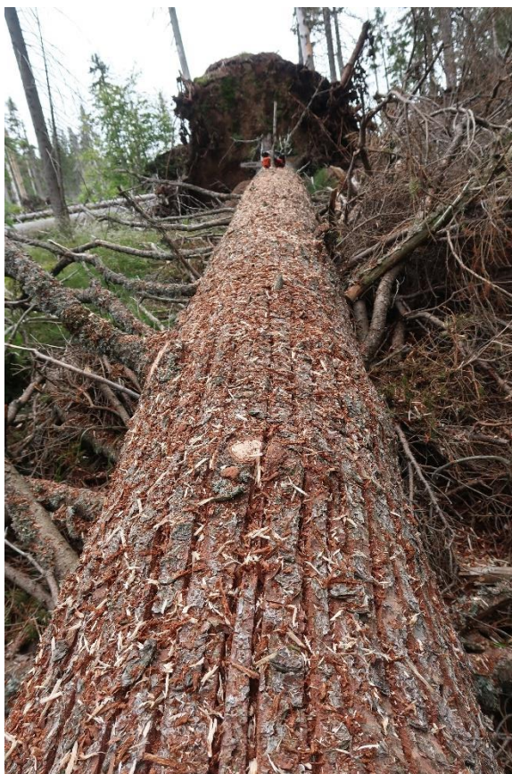
Obrázek 4: Kmen asanovaný drážkovou metodou