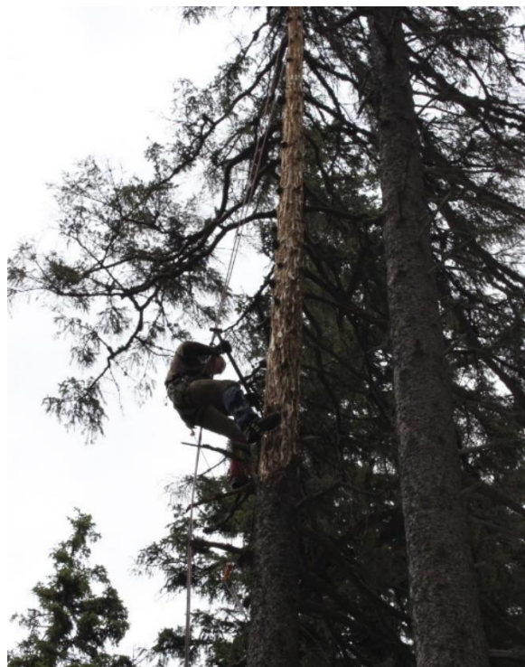
Obrázek 1: Provádění asanace stojících stromů pomocí ručního škrabáku

Provádí se jen v ojedinělých případech, jedná se o šetrný (nedestruktivní) způsob asanace, na ekologicky významných lokalitách, v chráněných územích, či v Národních parcích. Je to specifický způsob odkorňování, který se provádí pomocí ručního náradí. Práce je velmi náročná, vyžaduje velkou fyzickou kondici pracovníků. Odkorňování se provádí snáze, jestliže je kůrvec v pokročilých stádiích. Nejpozději metodu provádíme ve fázi kukel (Jakuš 2015). Metodu provádějí pracovníci, kteří mají kompetence pro práci ve výškách. Nejčastěji se jedná o horolezce, pracovníci výškového mytí oken, či arboristy se speciální horolezeckou soupravou. Při výstupu do koruny stromů se lezci snaží zachovat co nejvíce větví na stromě a odstraňují pouze ty, které jim brání ve výstupu. Při metodě s celoodvětvěním se strom odvětví celý. Cestou z koruny směrem dolů odlupují kůru stromu (viz. obrázek 1) (Juha 2005). Odkorňované kmeny se zalívají pryskyřicí, a protože kmen není chráněn borkou, tak rychle vyschne. To má za následek úbytek organismů, zejména citlivějších druhů hub. Tyto kmeny se následně pomaleji rozkládají. Příčinou je malé složení mykoflóry (NPŠ 2020).