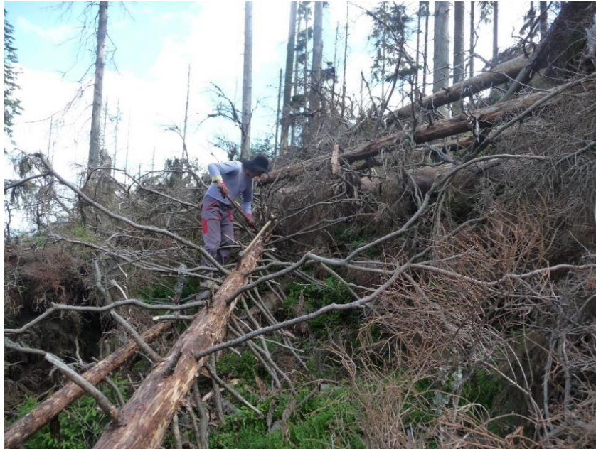
Obrázek 3: Asanace neodvětveného stromu pomocí ručního škrabáku