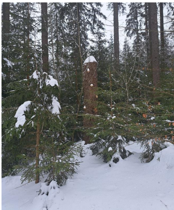
Obrázek 6: Smrkový pahýl