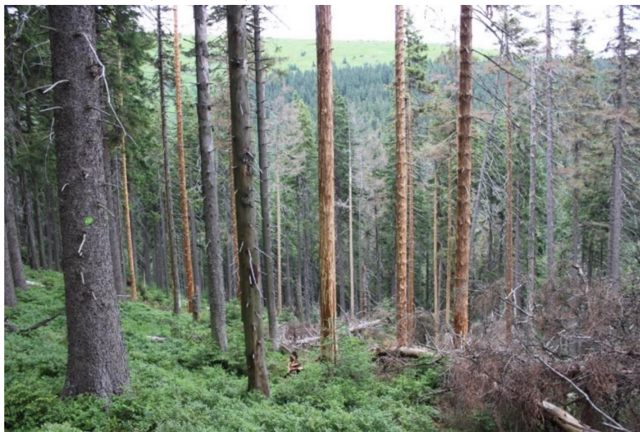
Obrázek 2: Asanované stojící stromy

Metodu musíme provést u včas vyhledaného kůrovcového stromu, účinné od stádia larev do stádia kukel. Při vhodném provedení je úmrtnost kůrovců až 100 %. Výkonnost této metody je 0,5 metru krychlových za hodinu. Cena za odkornění 0,5 m 3 stromu se pohybuje okolo 630 Kč (Juha 2005).