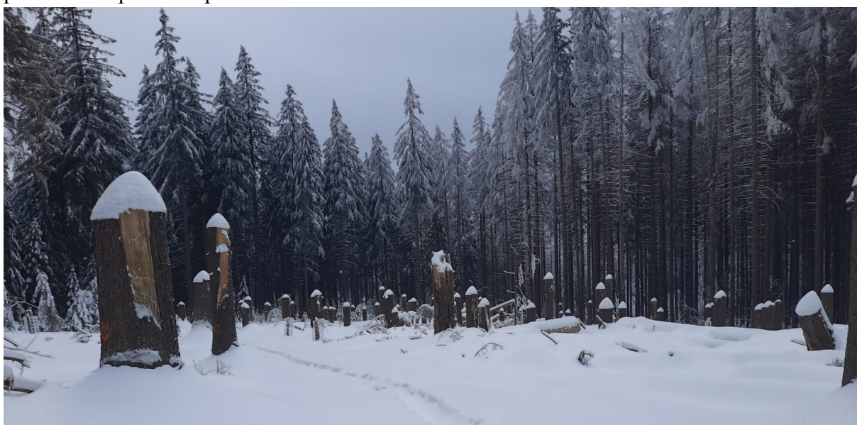
Obrázek 7: Ponechané pahýly smrku okolo cesty

V rezervaci se ošetřují napadené smrky asanací a to zejména v přirozených horských smrčínách, kde se provádí odkornění nastojato. V okolí cest se z bezpečnostních důvodů kácí okolní porosty na jednu výšku stromu. Stromy se kácí ve 2-5 metrech za účelem vytvoření pahýlů, které napodobují strukturu stojícího kmene. Ty se většinou neodkornují. Vývraty se ponechají na ploše nezkrácené, neodvětvené pouze odkorněné (viz. obrázek 7). Pro podporu biodiverzity se lesníci snaží odkornit celý kmen a ponechat neodkorněnou oddenkovou část cca do dvou metrů. Snaha je o zachování co nejvíce přirozeného prostředí po disturbanci.