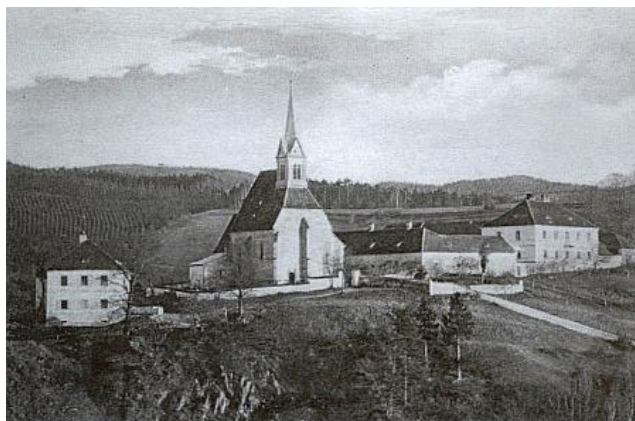
Příloha č. 1 Pohled na školu, kostel a faru v Zátoni, 20. léta 20. století (pohlednice ze sbírek Jihočeského muzea ČB)

Zdroj: https://www.kohoutikriz.org/images/ullme7.jpg