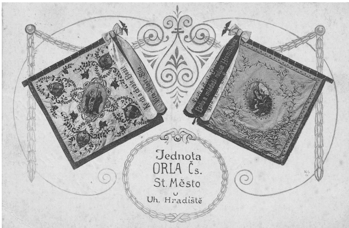
Pohled z roku 1926.