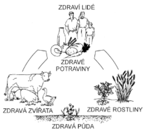
Obrázek 1: Koloběh ekologického hospodaření

Tato zásada poukazuje na to, že zdraví jednotlivců a komunit nelze oddělit od zdraví ekosystémů => zdravá půda produkuje zdravé plodiny, které podporují zdraví zvířat a lidí.