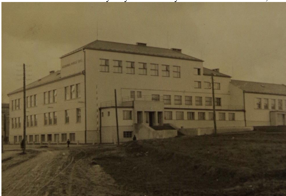
Příloha č. 2 – Budova Masarykovy obecné školy na dnešní ulici Školská, rok 1937