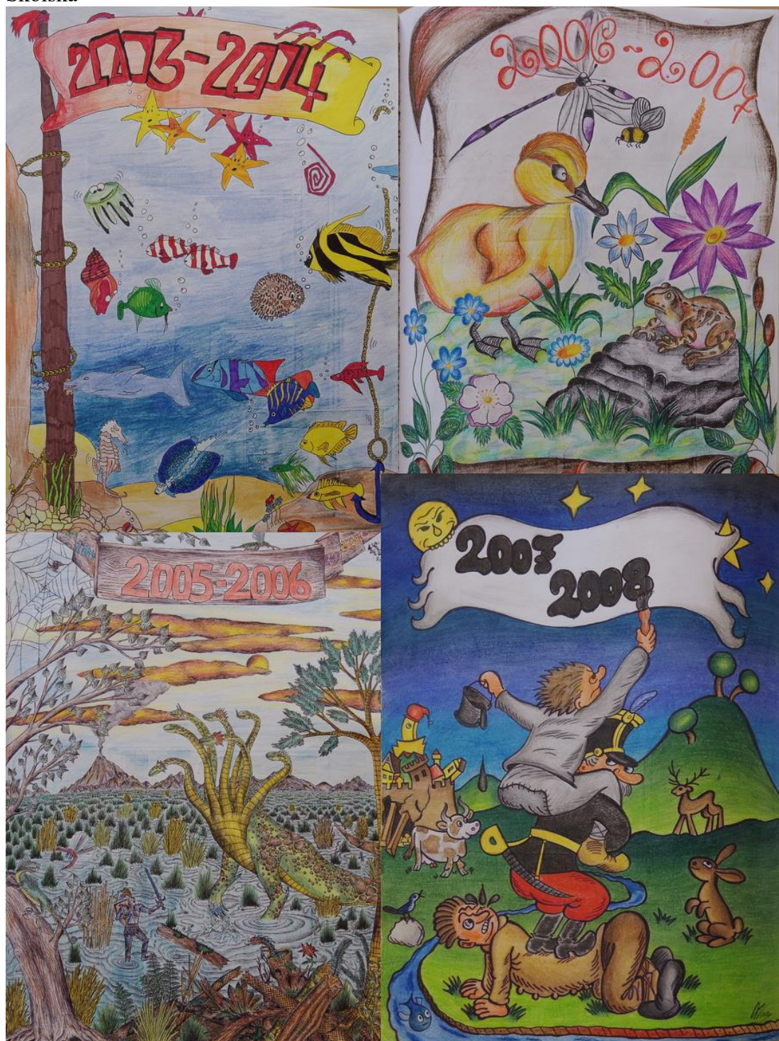
Příloha č. 5 – Titulní strany vybraných školních let, školní kroniky Základní škola Zábřeh Školská