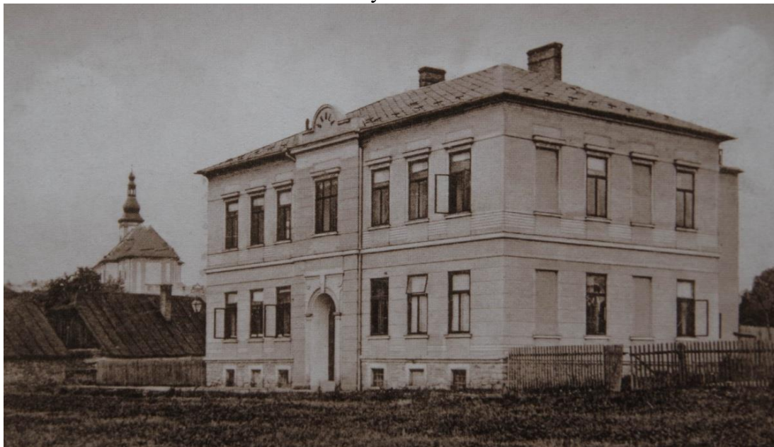
Příloha č. 1 – Budova české obecné školy na dnešní ulici Školská