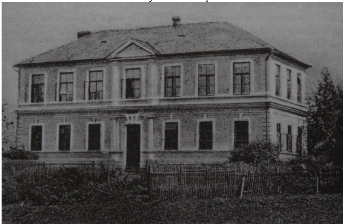
Příloha č. 3 – Budova Základní školy Skalička na počátku 20. století

Zdroj: Skoumalová, A.: Archiv obce Skalička. In: Sborník státního okresního archivu Šumperk, 2014, 7, s. 32.