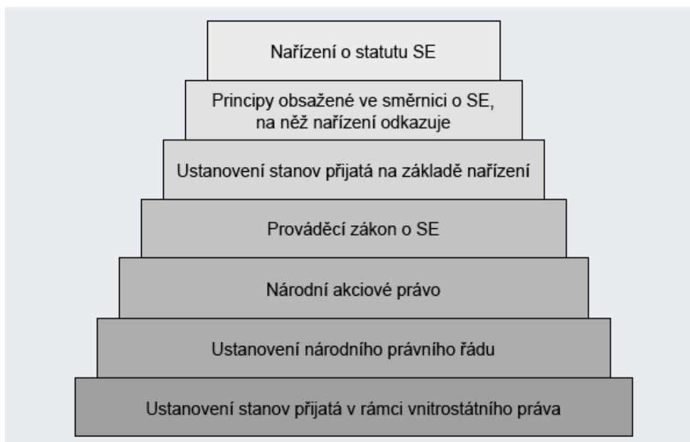
Obr. 2. Přehled právních předpisů SE 25