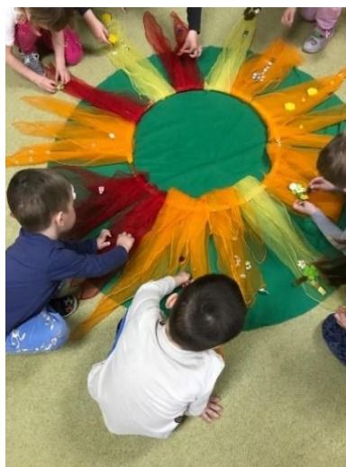
Obrázek 2. Zdobení paprsku