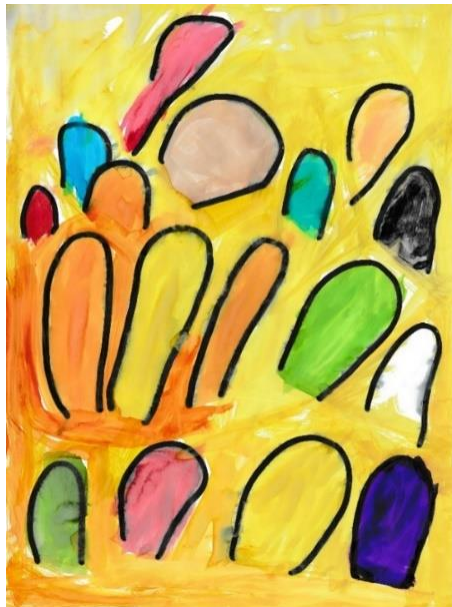
Obrázek 14. Obraz dítěte 2 na skladbu „Ballade pour Adeline“.