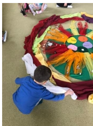
Obrázek 4. Přikládání šátku ke spirále