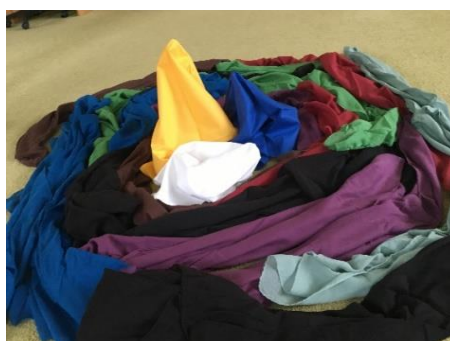
Obrázek 10. Spirála barevných šátků.

Následně se pedagog přesune se staršími dětmi ke stolu, kde mají přichystané Centropeny a anilinové barvy s vodou. Děti nejdříve Centropenem nakreslí linie či tvary a následně obraz doplní barvami, které v hudbě slyší. Poté děti dají své výtvary do sušáků. Po uschnutí následuje reflektivní dialog.