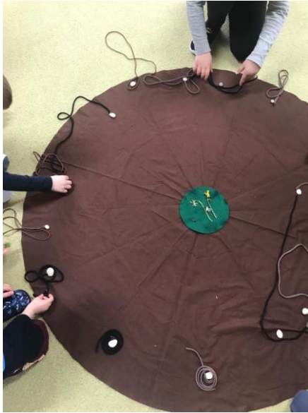
Obrázek 8. Tvoření rostlin