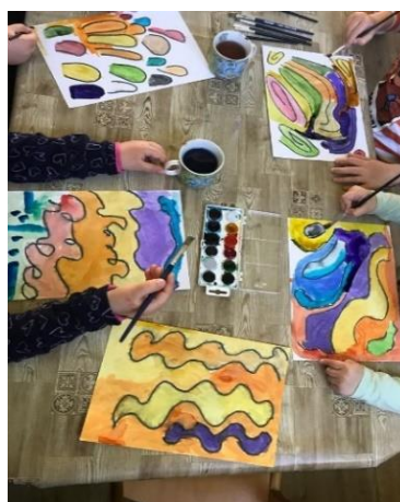
Obrázek 7. Malba na skladbu Ballade pour Adeline