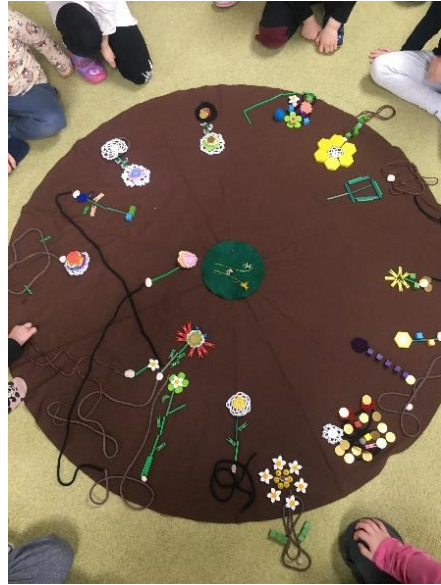
Obrázek 9. Vytvořené rostliny