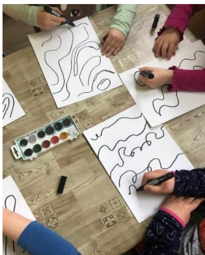
Obrázek 5. Kresba melodie