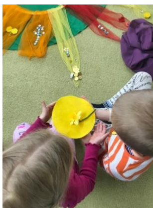
Obrázek 3. Předávání narcisu

kou barvu nám píseň hraje. Každý z nás v ní může vidět, slyšet jiné barvy nebo tvary. Někomu, tam bude hrát barva bílá, jako je sněženková víla, někomu bude hrát fialová barva anebo žlutá barva. Každý z nás je jiný a jedinečný a může vidět jinou barvu. Teď vás poprosím, abyste zavřely oči.“ Pedagog pustí hudbu. Po poslechu hudby dojde pedagog k připraveným barevným šátkům a vybere barvu, kterou v něm hudba evokovala a pokládá šátek ke kruhu. Další dítě bez mluvení položí svůj šátek vedle pedagoga. Postupně nám vznikne barevná spirála. Po vytváření spirály pedagog nechá prostor pro vyjádření dojmů a prožitků, kterým v nich hudba zanechala. Poté si předškoláci sednou ke stolu, kde budou mít připravené papíry, fixy, vodu a anilinové barvy. „Teď se z vás stanou opravdoví malíři. Zkusíte hudbu namalovat na papír.“ Pustí se opět hudba. Děti si nejprve vezmou do ruky černý Centropen a zkouší rukou ve vzduchu sjednotit pohyb s hudbou. Poté každý nakreslí svou představu melodie fixou na papír. Následně si vezme štětec a nanese barvu na papír. Po zaschnutí obrazů si vytvoříme galerii, kde si díla prohlédneme a každé dítě své dílo s pedagogem reflektuje.