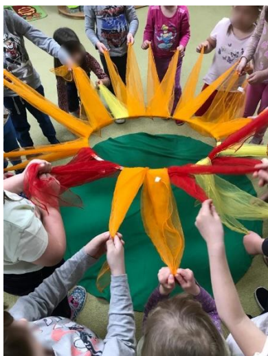
Obrázek 1 Zvedání slunce