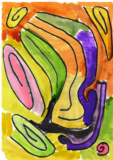
Obrázek 15. Obraz dítěte 3 na skladbu „Ballade pour Adeline“.