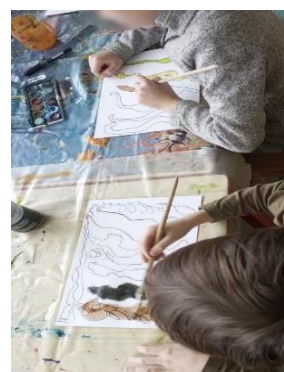
Obrázek 12. Malba na skladbu