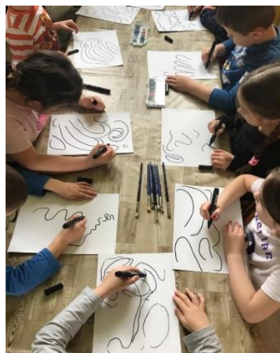
Obrázek 6. Kresba melodie