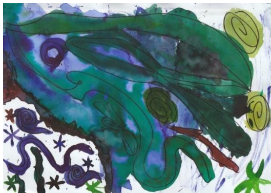
Obrázek 18. Obraz dítěte 6 na skladbu „Mysterious Forest“.

„Neudělala bych tam tyhle modrý.“ (ukázání na modré čáry v pravém dolním okraji.)