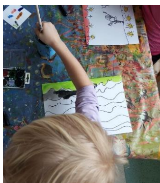
Obrázek 11. Malba na skladbu