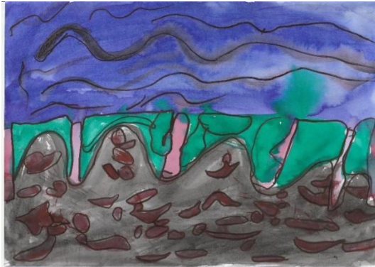
Obrázek 17. Obraz dítěte 5 na skladbu „Mysterious Forest“.

„To modré je voda a můj šátek. Potom je tam les hlína a cibulky.“