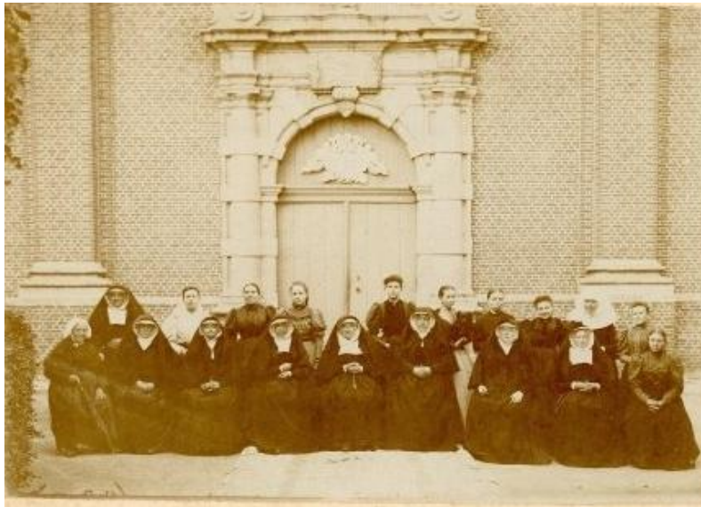
foto van onbekende begijninnen van het museum in Hoogstraten