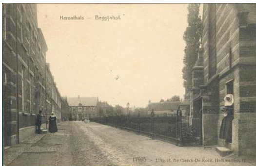
SAH collectie postkaarten van Herentals, jaar 1907 3

Er zijn drie basistypen van begijnhoven te vinden. Het eerste type is een pleinbegijnhof met huizen of gebouwen die rond een centraal plein geplaatst werden. Het plein kon vaak als een begraafplaats dienen of ook als een grasweide voor vee. In het midden of aan het einde van het plein prijkt een kapel of een kerk die de hoofdgebouw van de hele begijnhof was terwijl de andere gebouwen rondom de kerk lagen. Dit plein was vaak driehoekig zoals in Diksmuide, Dendermonde of in Herentals.