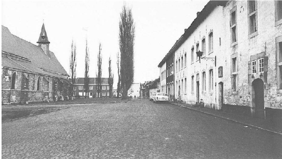
oude foto van het begijnhof te Sint-Truiden 7

Bij het bouwen van elk begijnhof was er een tendens om een harmonieuze verhouding te maken tussen open ruimte die kerkhof, boomgaard, kruidentuin bevat een private ruimte. 8