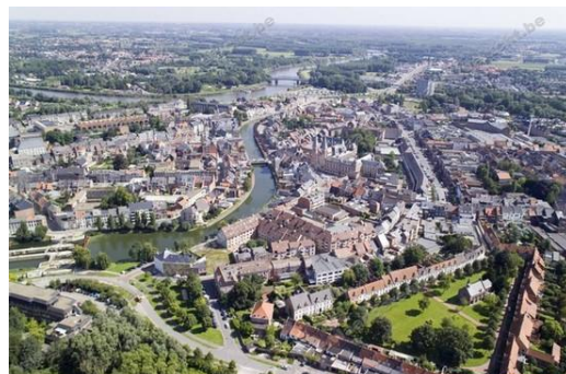
foto van wandelroute Herentals 4