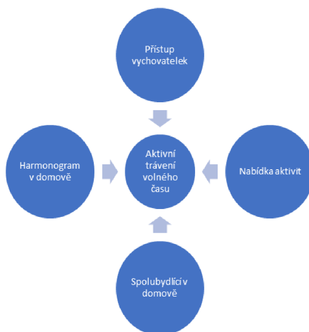
Schéma 2 – Paradigmatický model v selektivním kódování

Centrální klíčovou kategorii jsem ve své práci identifikovala jako kategorii nazvanou „aktivní trávení volného času“. Všechny ostatní kategorie k ní vedou (jak ukazuje schéma č. 2). Všichni respondenti tráví svůj volný čas velmi aktivně. Respondenti v rozhovorech uváděli, že nemají žádné volné chvíle, ve kterých by se nudily či ve kterých by svůj volný čas využívali pasivně. Z analýzy dat vyšlo, že pro aktivní trávení volného času jsou klíčové čtyři hlavní kategorie. Nejprve uvedme kategorii nazvanou „Přístup vychovatelek.“ V dětském domově se u dětí střídají dvě vychovatelky. Obě dvě vychovatelky mají k dětem velice blízký osobní vztah, díky kterému mají příležitost děti pozitivně motivovat k aktivnímu trávení volného času. Obě dvě vychovatelky se ve své profesi snaží dětem vymýšlet nejrůznější program (výlety, tvoření, divadlo, tábory, dovolené apod.) Všichni respondenti uvedli, že mají od