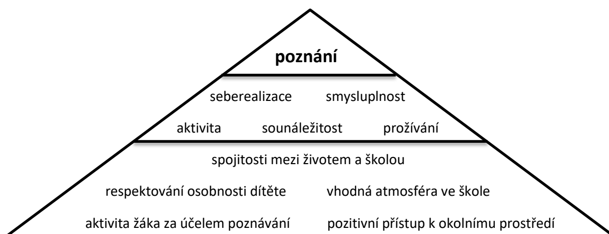
Obr. 1 – Pyramida faktorů ovlivňujících rozvoj dítěte ve škole

Kašová (1995) uvádí, že proti tradiční škole tak během projektového vyučování přikládáme zvýšený význam na přítomnost faktorů, které během tradičního způsobu výuky bývají mnohdy potlačovány. V důsledku toho do hry vstupují pozitivní podněty, které umožňují žákům cestu za poznáním. Dovolil jsem si na základě jejích poznatků (1995) vybrat informace, které považuji za nejdůležitější a vytvořit z nich jakousi pyramidu. Její spodní část symbolizuje základ, jehož přítomnost ve škole je nutná k potřebnému rozvoji dítěte. Ten je následně předpokladem pro cestu za poznáváním: